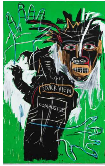
Jean-Michel Basquiat, Self-Portrait as a Heel (Part Two), 1982, acrylique et huile sur toile, 243,8 x 156,2 cm. Lot adjudgé 39 millions d'euros chez Sotheby's New York le 15 novembre.

Après une première semaine new-yorkaise éclatante (voir QDA du 13 novembre ), Sotheby's a continué sur sa lancée spectaculaire avec un total de 630 millions d'euros la semaine suivante. La vente du soir d'art moderne a totalisé 210 millions d'euros le 13 novembre. Un tableau de Chagall de 1924 Au-dessus de la ville (14,6 millions d'euros) ; Comptoir et guitare (1932) de Picasso (22 millions d'euros), qui compte parmi les natures mortes les plus chères de l'artiste, et deux tableaux de Monet, Le Moulin de Limetz (1888) et Peupliers au bord de l'Epte, temps couvert (1891), emportés pour 24 et 28,8 millions d'euros, en ont été les vedettes. Notons aussi La Patience (1943-1948) de Balthus, vendu par l'Art Institute de Chicago, partie à 13,7 millions d'euros dans son