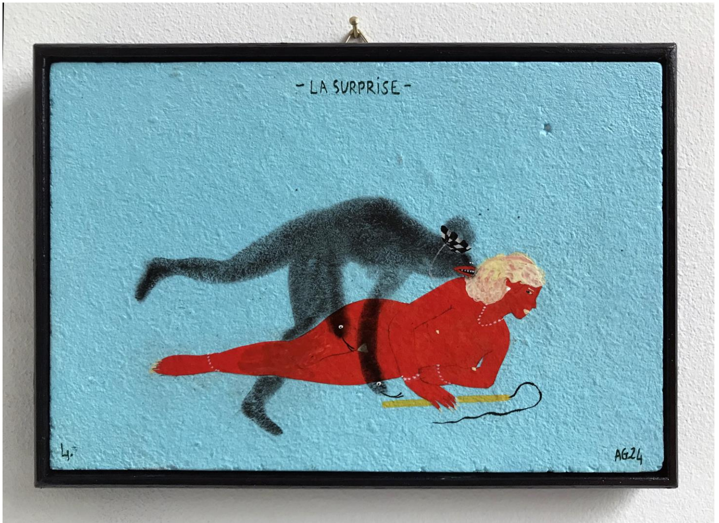
« La surprise » (4)

2024, tech mixte sur bois / mixed media on wood, 11x16cm