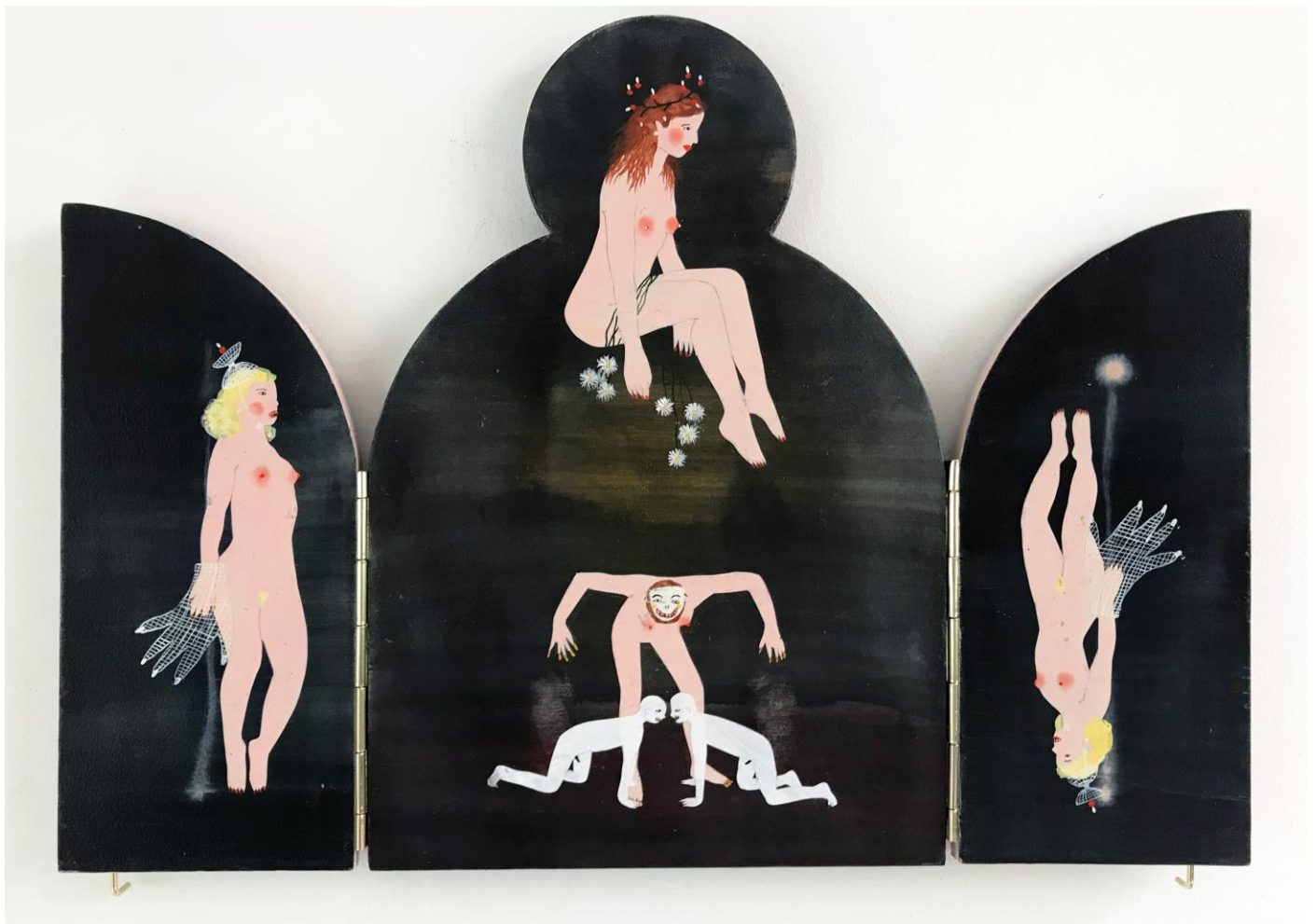
« La nuit est encore debout, c'est pour ça que je ne dors pas » (9) (ouvert / open) 2024, tech mixte sur bois / mixed media on wood, 26x18x2,5cm