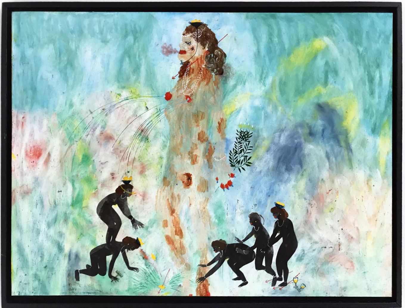
« Les géantes » (3)

2024, tech mixte sur bois / mixed media on wood, 42x29,7cm