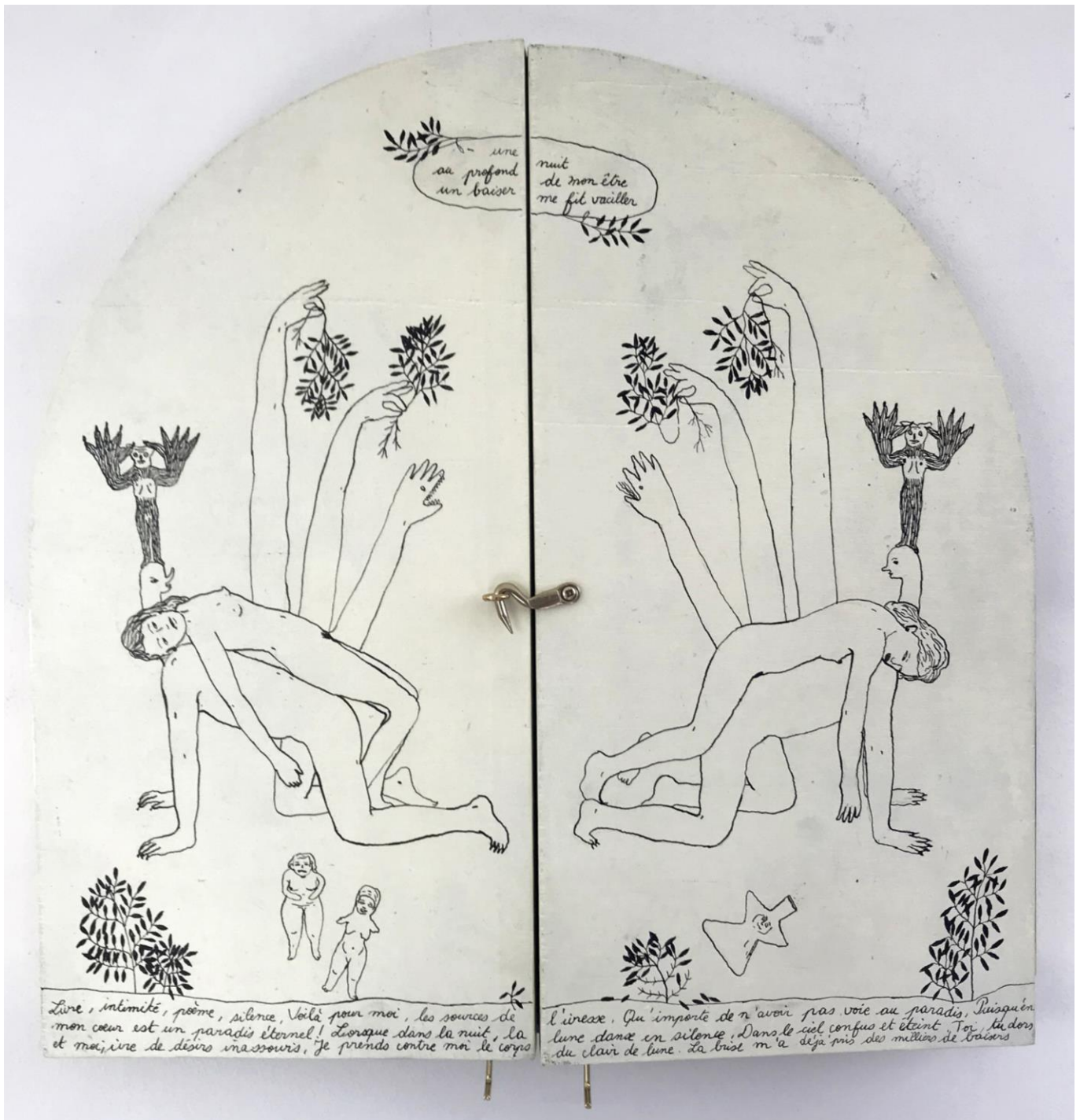
« La nuit est encore debout, c'est pour ça que je ne dors pas » (19) (fermé / closed)

2024, tech mixte sur bois / mixed media on wood, 30x30x2,5cm