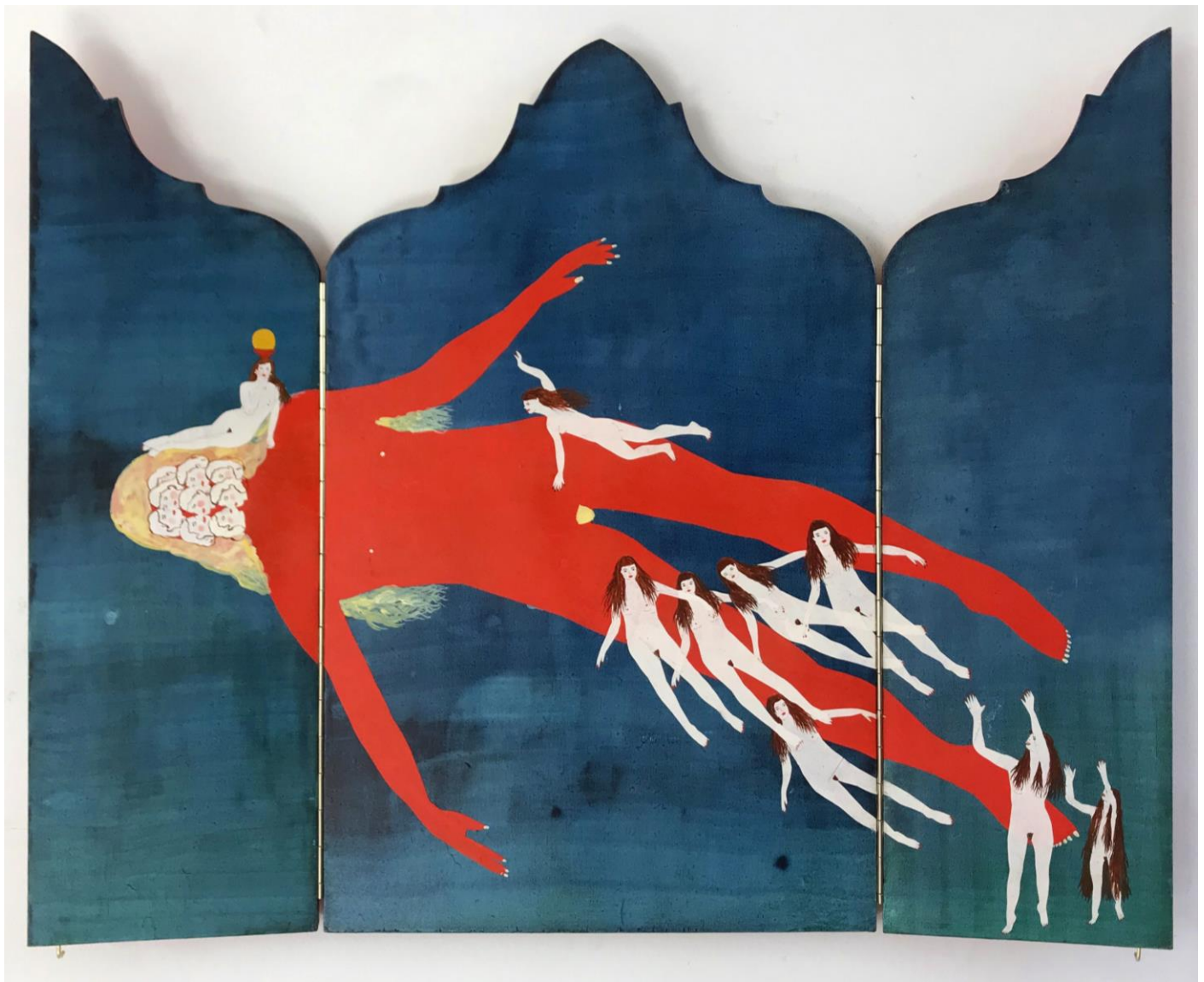
« La nuit est encore debout, c'est pour ça que je ne dors pas » (24) (ouvert / open) 2024, tech mixte sur bois / mixed media on wood, 47x29,5x2,5cm