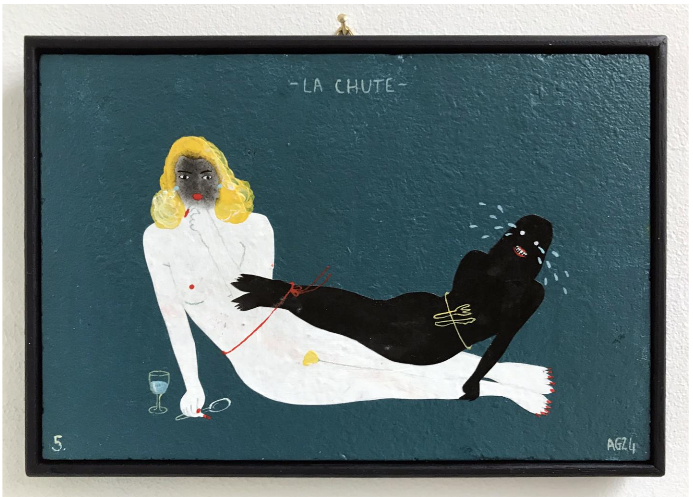
« La chute » (5)

2024, tech mixte sur bois / mixed media on wood, 11x16cm