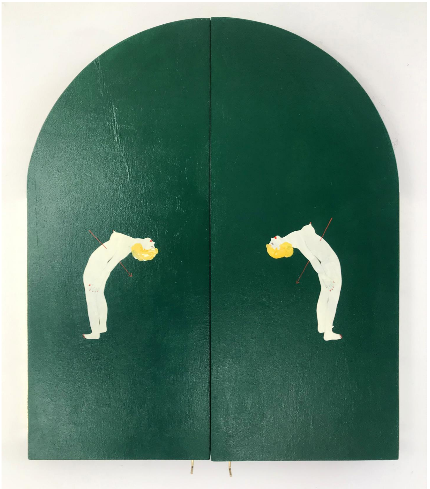
« La nuit est encore debout, c'est pour ça que je ne dors pas » (22) (fermé / closed) 2024, tech mixte sur bois / mixed media on wood, 38x31x2,5cm