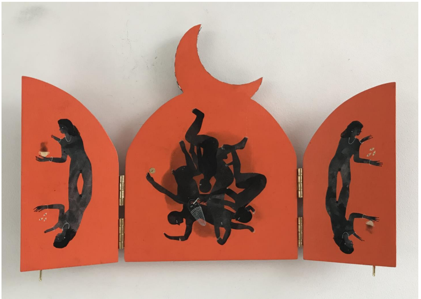
« La nuit est encore debout, c'est pour ça que je ne dors pas » (3) (ouvert / open) 2024, tech mixte sur bois / mixed media on wood, 20,5x15x2,5cm