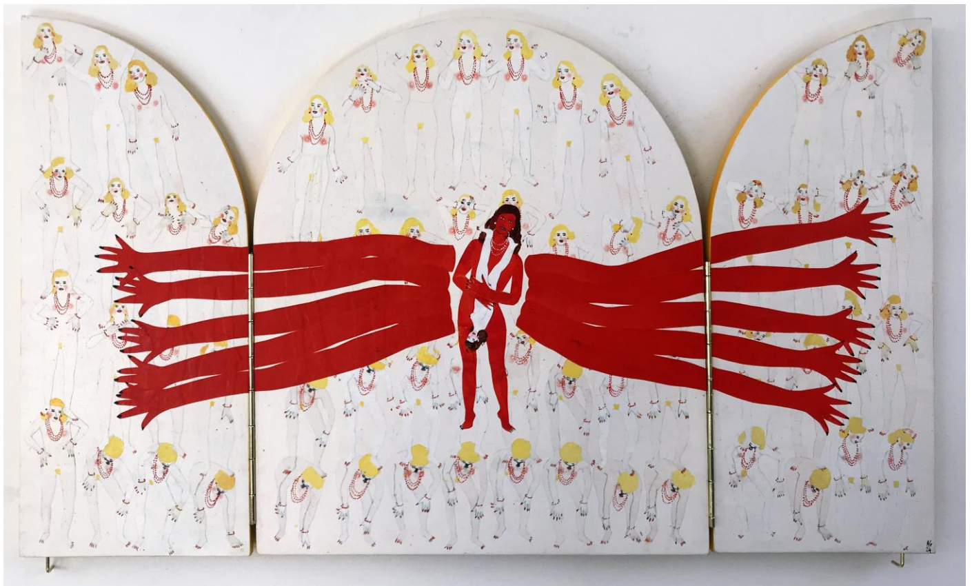
« La nuit est encore debout, c'est pour ça que je ne dors pas » (21) (ouvert / open) 2024, tech mixte sur bois / mixed media on wood, 30,5x26,5x2,5cm