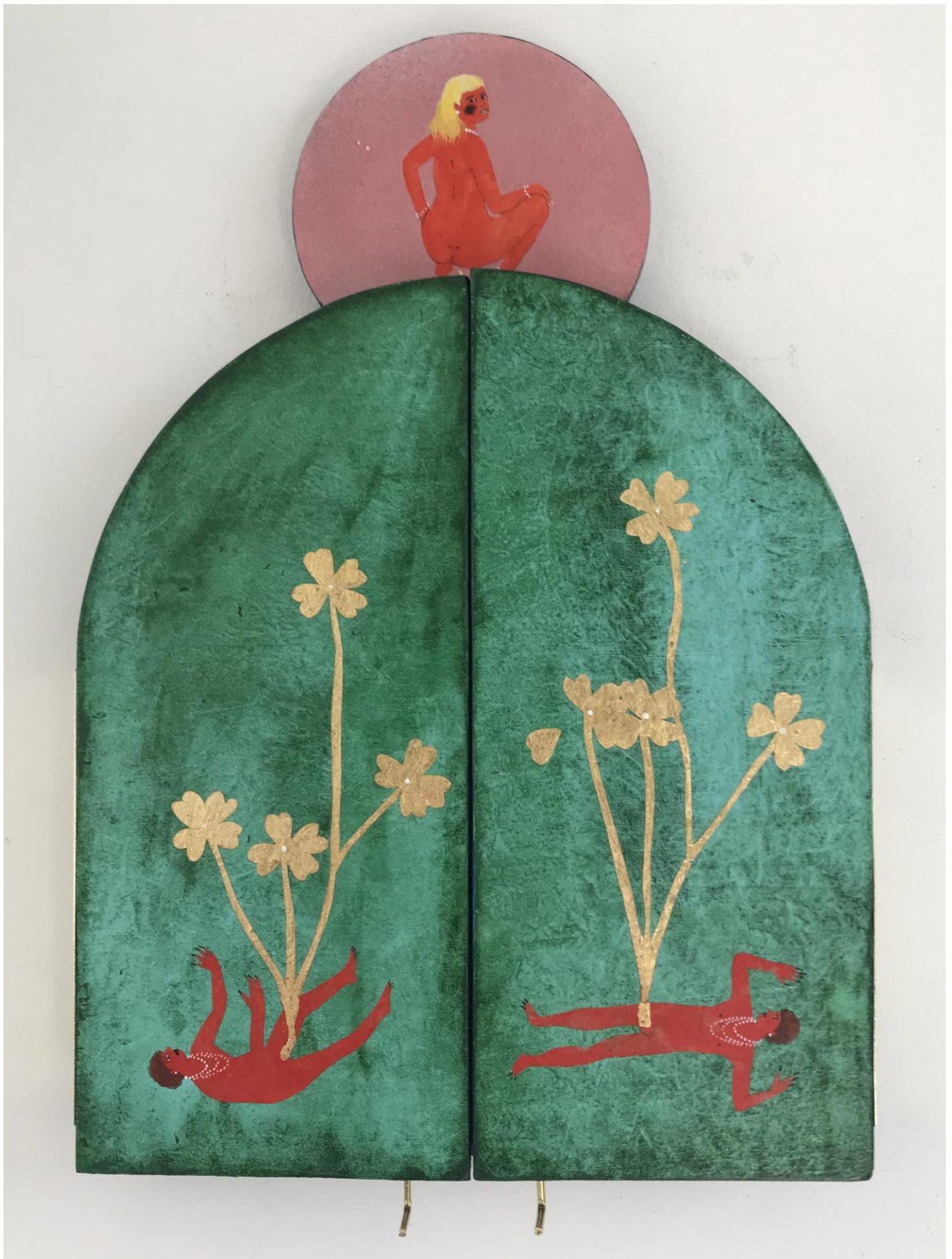
« La nuit est encore debout, c'est pour ça que je ne dors pas » (2) (fermé / closed) 2024, tech mixte sur bois / mixed media on wood, 26x18x2,5cm