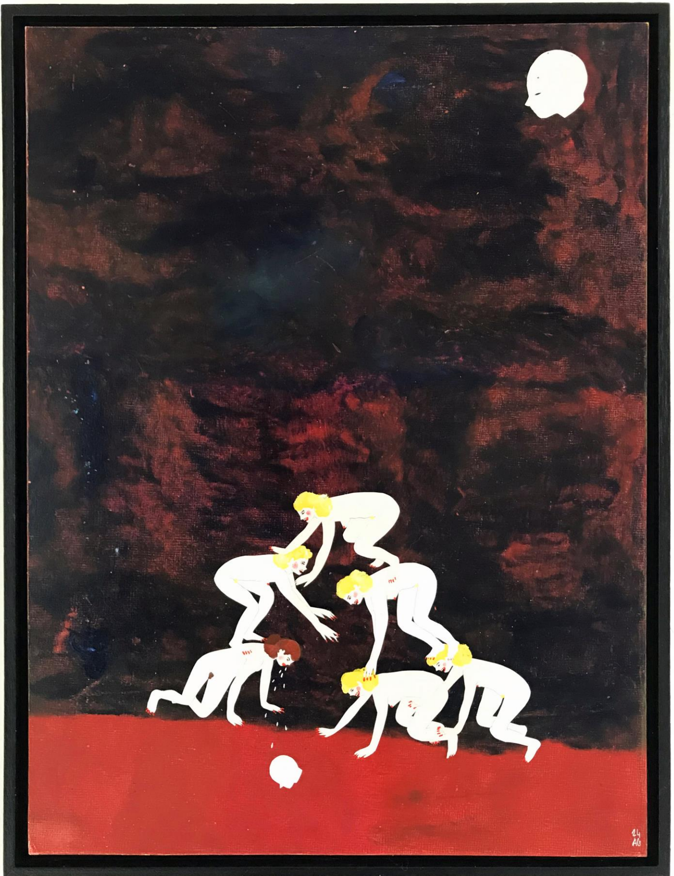
« Les géantes » (1)

2024, tech mixte sur bois / mixed media on wood, 42x29,7cm