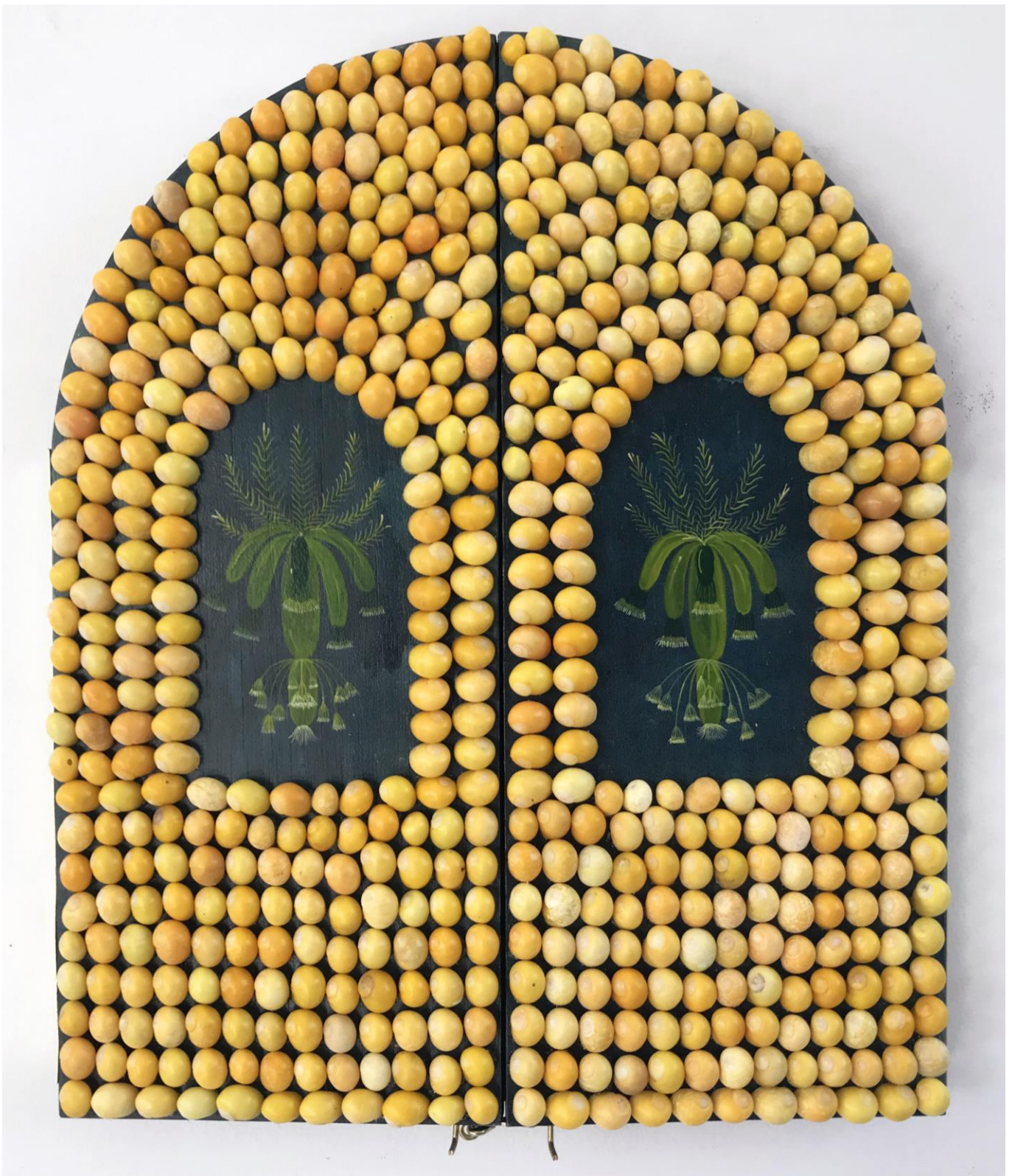
« La nuit est encore debout, c'est pour ça que je ne dors pas » (25) (fermé / closed) 2024, tech mixte sur bois / mixed media on wood, 39x31x3cm