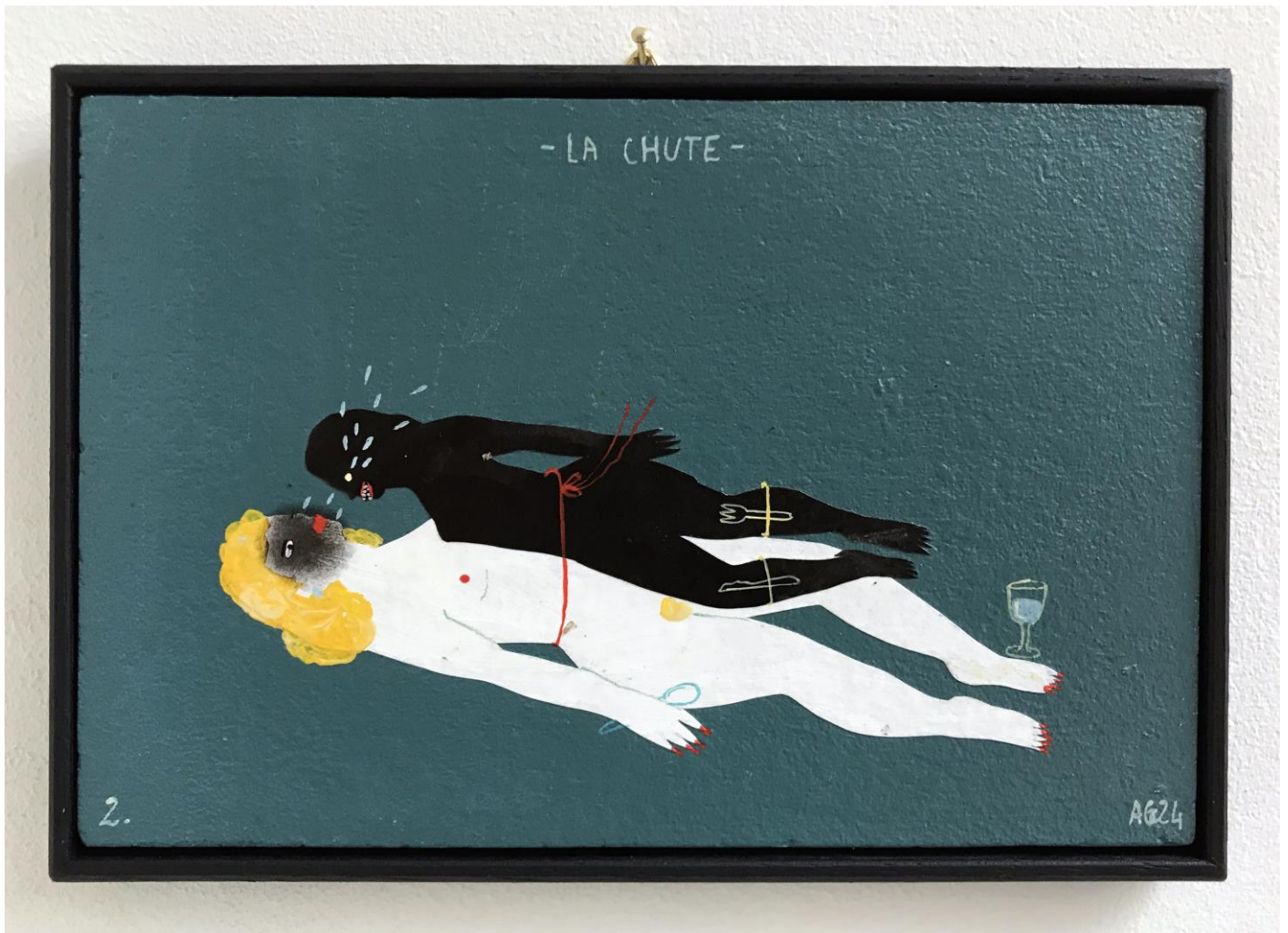
« La chute » (2) 2024, tech mixte sur bois / mixed media on wood, 11x16cm