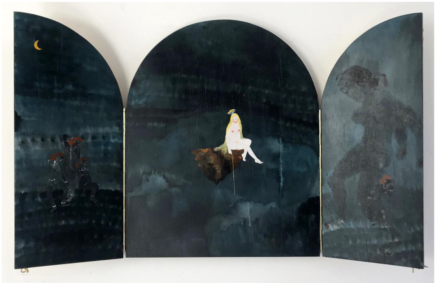
« La nuit est encore debout, c'est pour ça que je ne dors pas » (25) (ouvert / open) 2024, tech mixte sur bois / mixed media on wood, 39x31x3cm