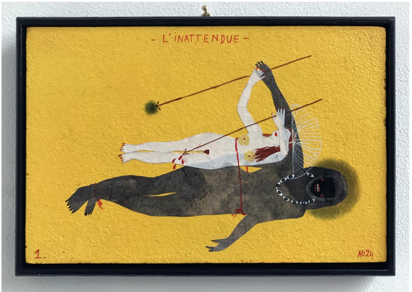
« L'inattendue » (1)

2024, tech mixte sur bois / mixed media on wood, 11x16cm