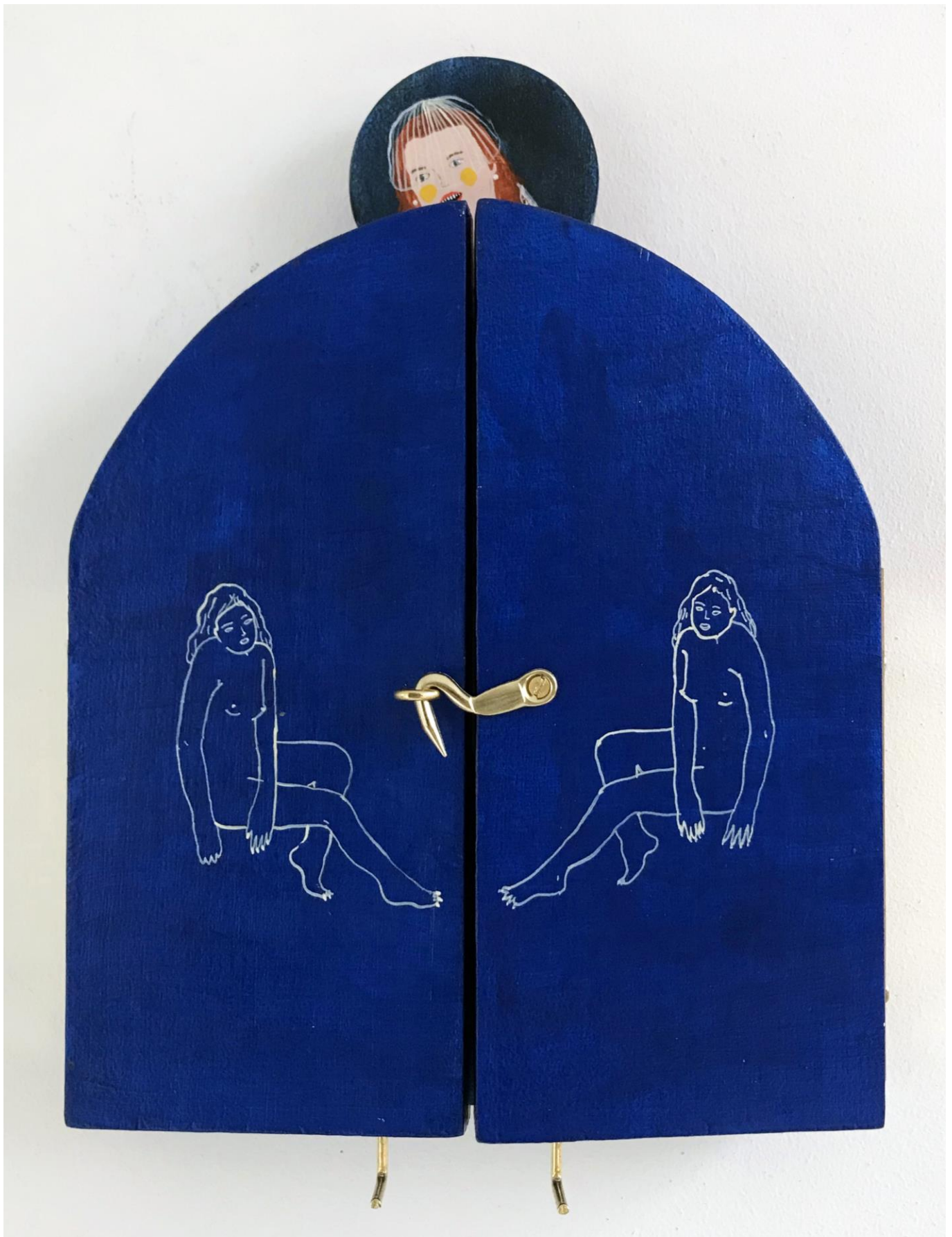
« La nuit est encore debout, c'est pour ça que je ne dors pas » (6) (fermé / closed) 2024, tech mixte sur bois / mixed media on wood, 20x15x2,5cm