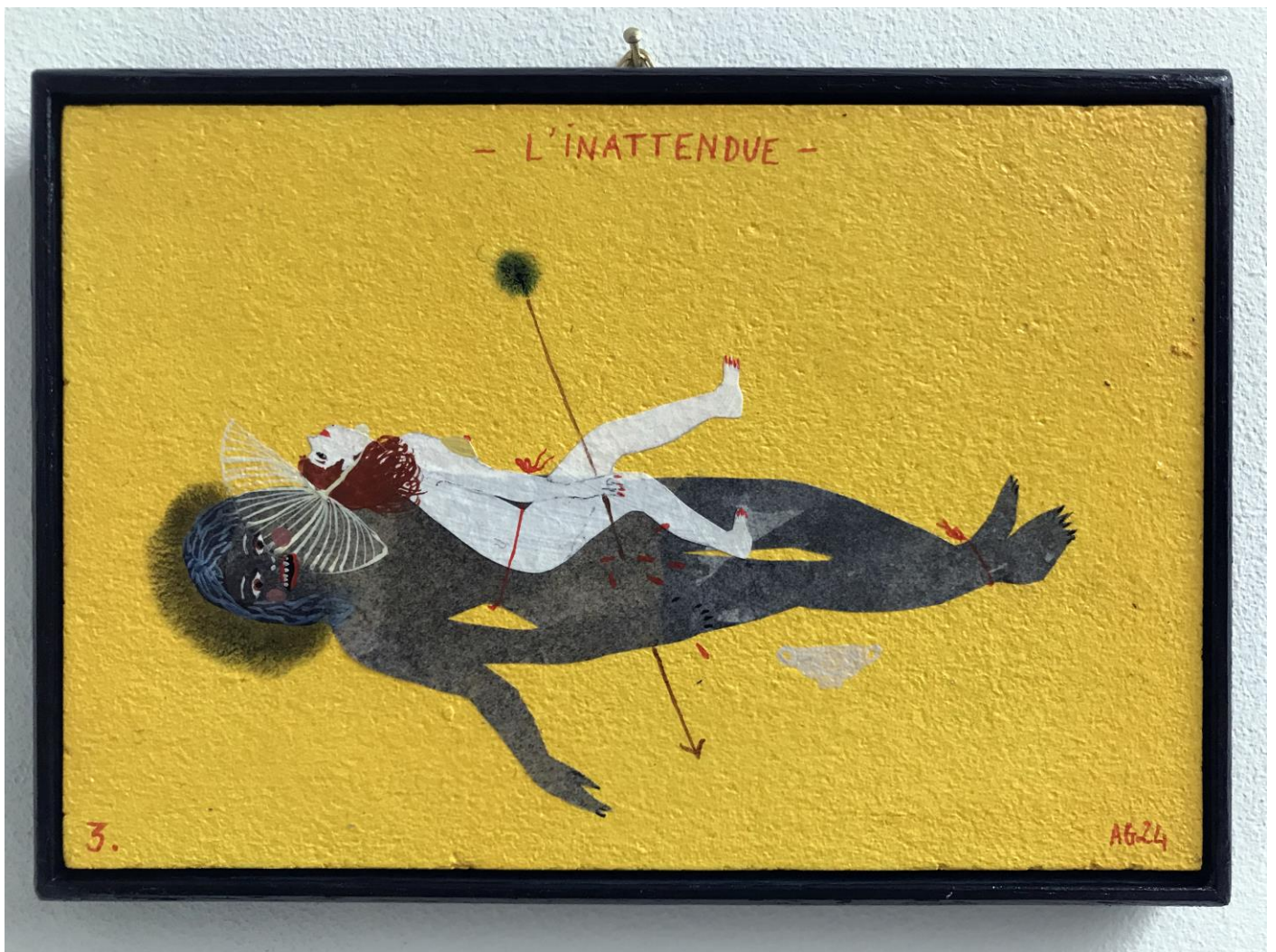
« L'inattendue » (3)

2024, tech mixte sur bois / mixed media on wood, 11x16cm