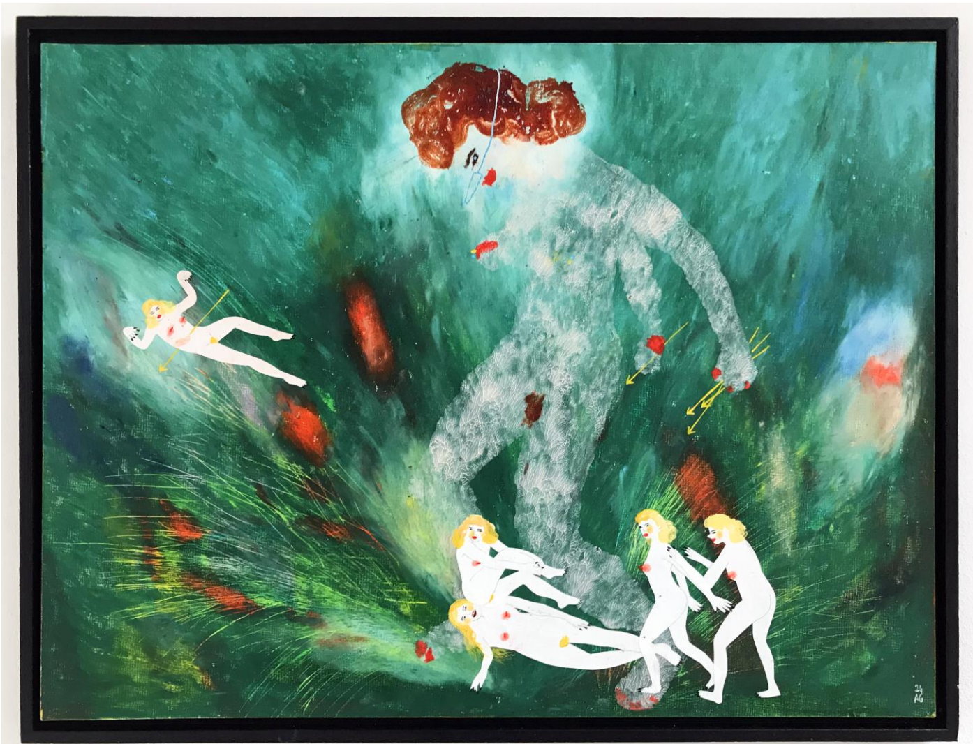
« Les géantes » (2)

2024, tech mixte sur bois / mixed media on wood, 42x29,7cm