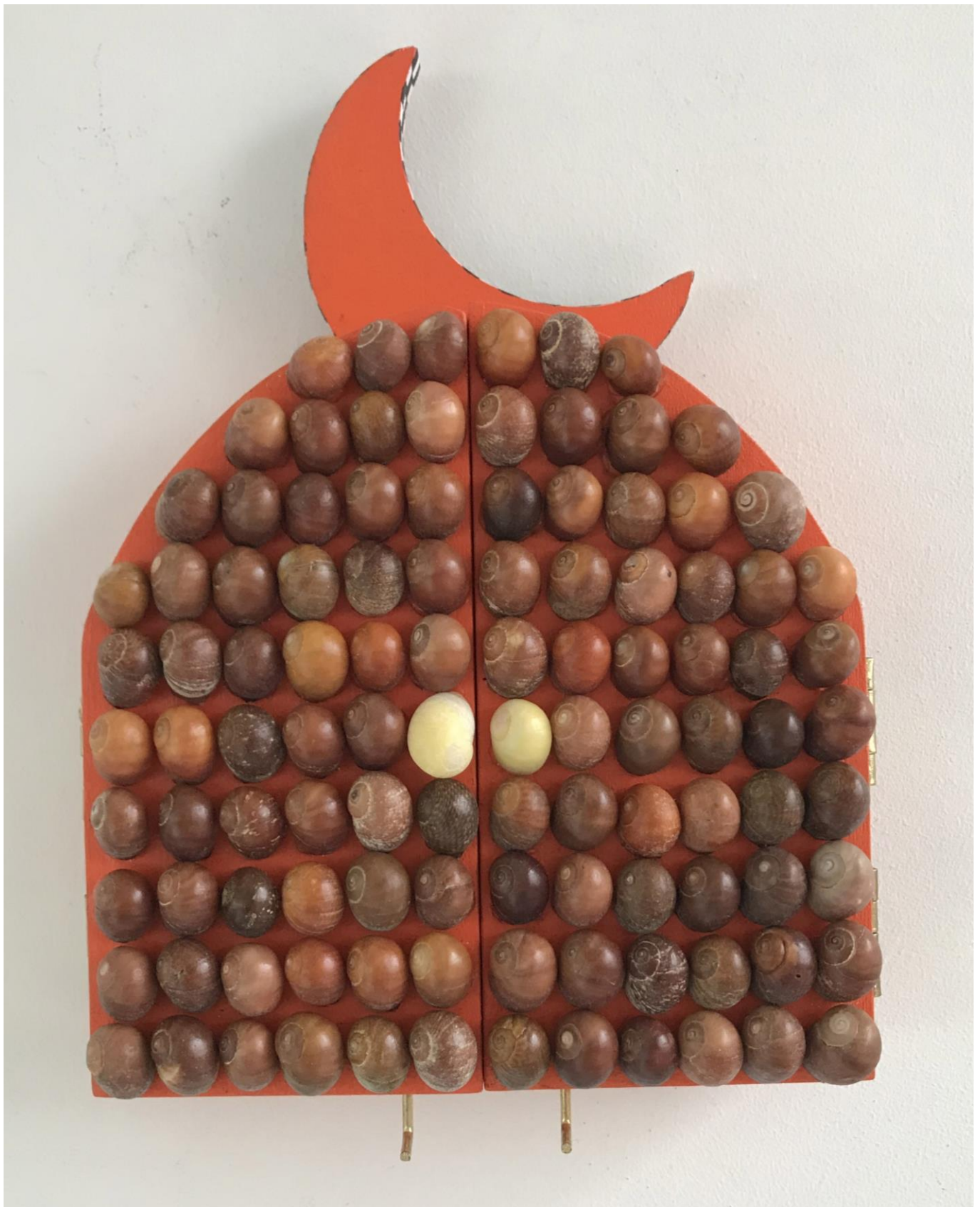
« La nuit est encore debout, c'est pour ça que je ne dors pas » (4) (fermé / closed) 2024, tech mixte sur bois / mixed media on wood, 20,5x15x2,5cm