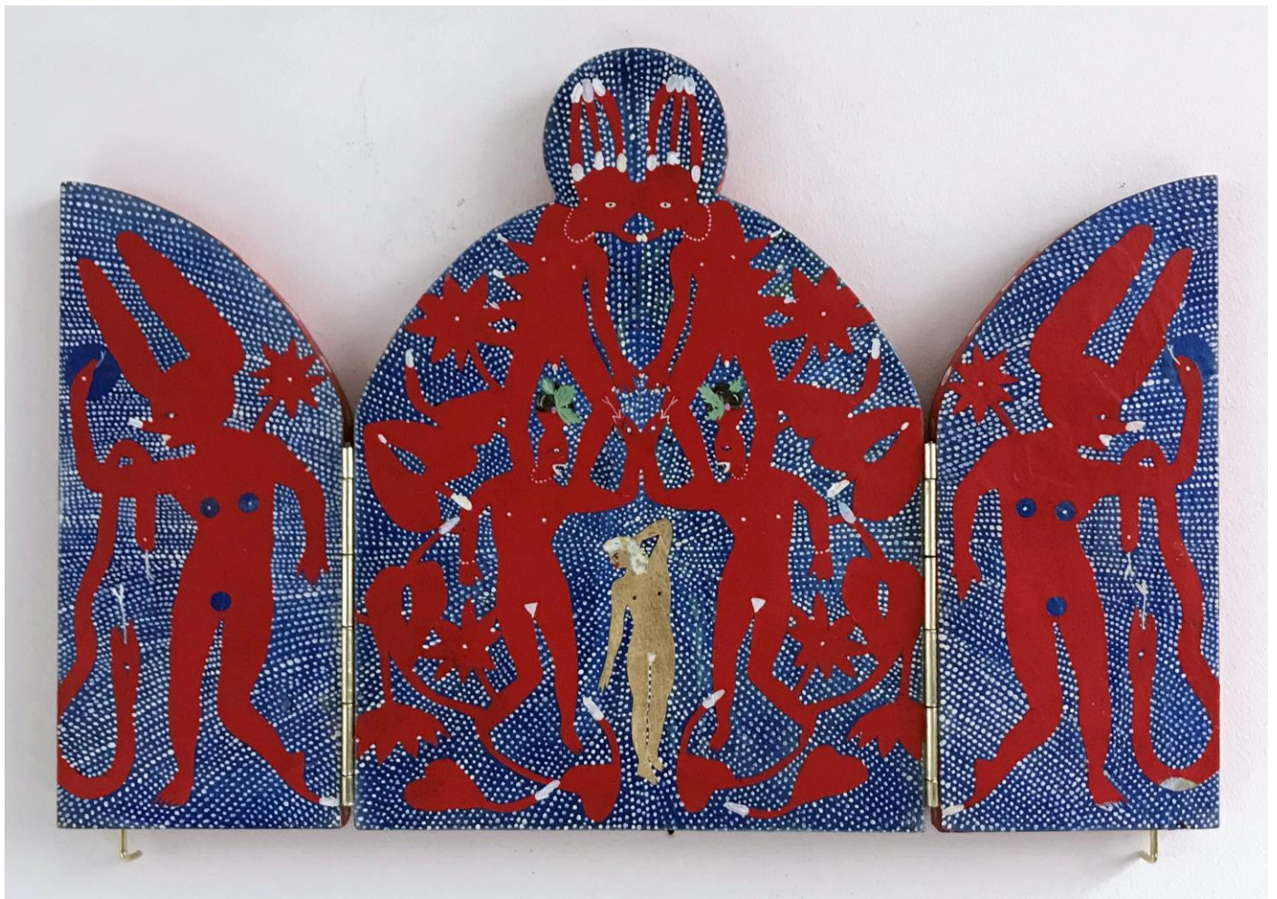
« La nuit est encore debout, c'est pour ça que je ne dors pas » (1) (ouvert / open) 2024, tech mixte sur bois / mixed media on wood, 20,5x15x2,5cm