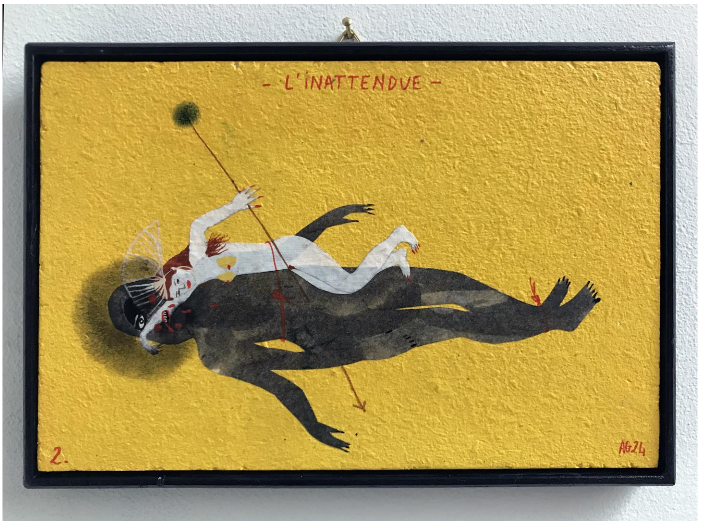
« L'inattendue » (2)

2024, tech mixte sur bois / mixed media on wood, 11x16cm