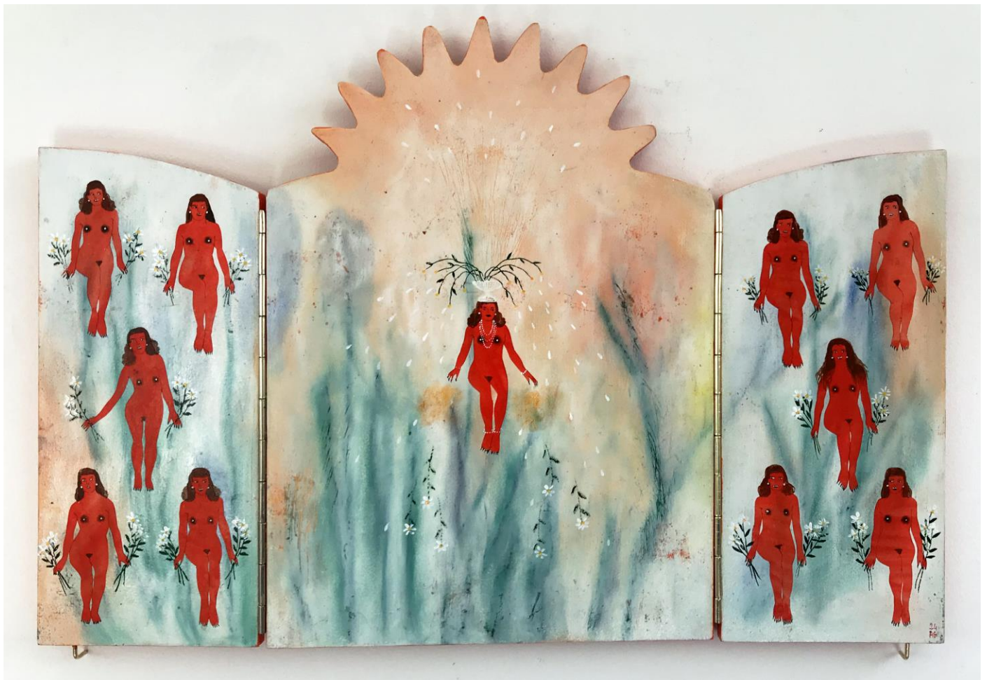
« La nuit est encore debout, c'est pour ça que je ne dors pas » (18) (ouvert / open)

2024, tech mixte sur bois / mixed media on wood, 30x21x2,5cm