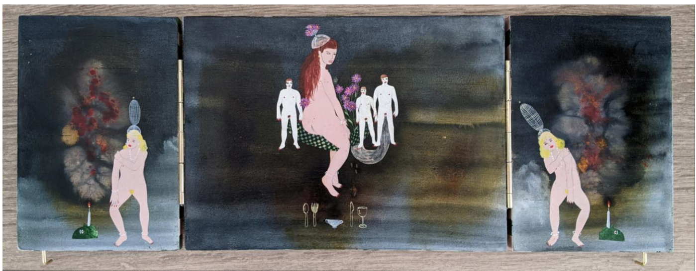
« La nuit est encore debout, c'est pour ça que je ne dors pas » (13) (ouvert / open) 2024, tech mixte sur bois / mixed media on wood, 15x21x2,5cm