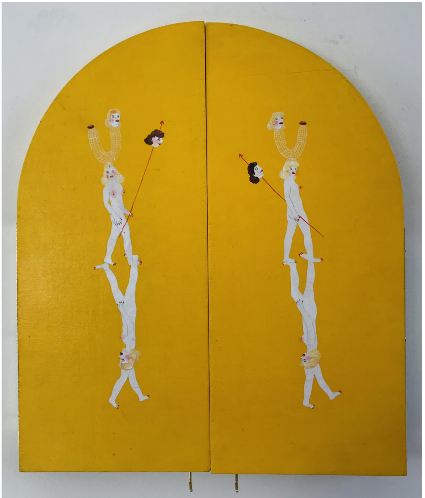
« La nuit est encore debout, c'est pour ça que je ne dors pas » (21) (fermé / closed) 2024, tech mixte sur bois / mixed media on wood, 30,5x26,5x2,5cm