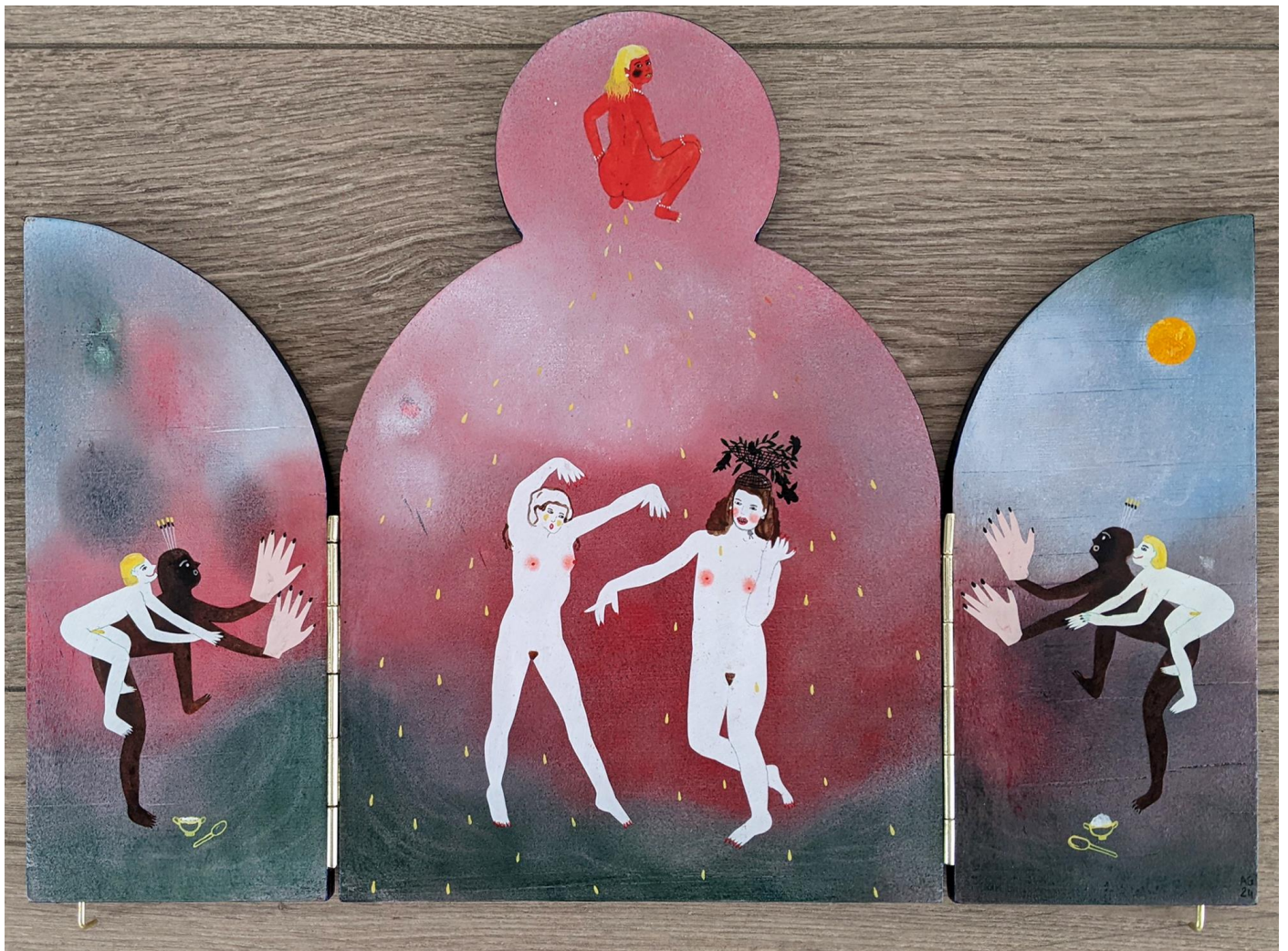
« La nuit est encore debout, c'est pour ça que je ne dors pas » (2) (ouvert / open) 2024, tech mixte sur bois / mixed media on wood, 26x18x2,5cm