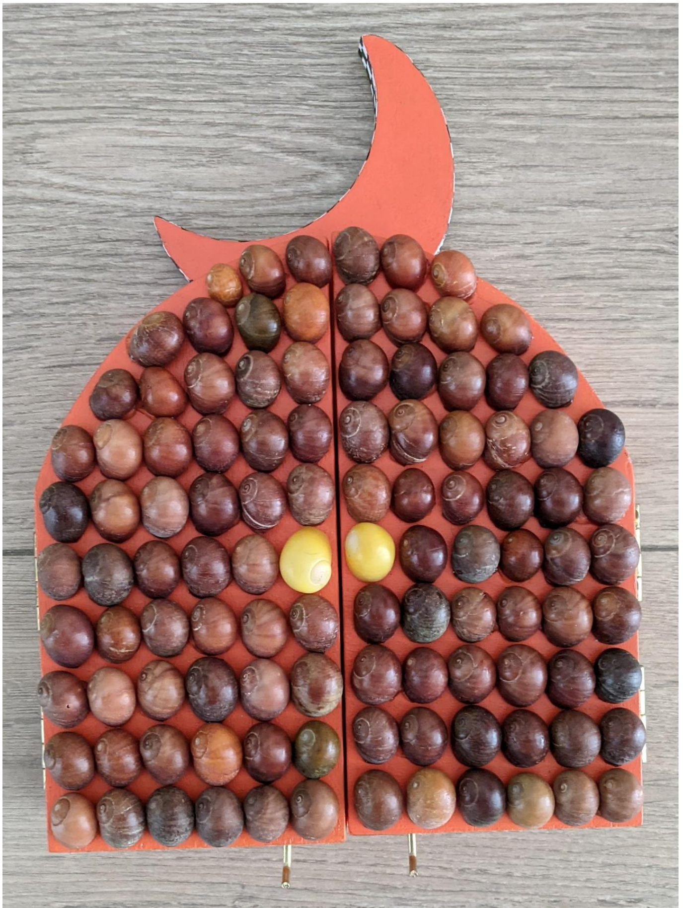
« La nuit est encore debout, c'est pour ça que je ne dors pas » (27) (fermé / closed) 2024, tech mixte sur bois / mixed media on wood, 20,5x15x2,5cm