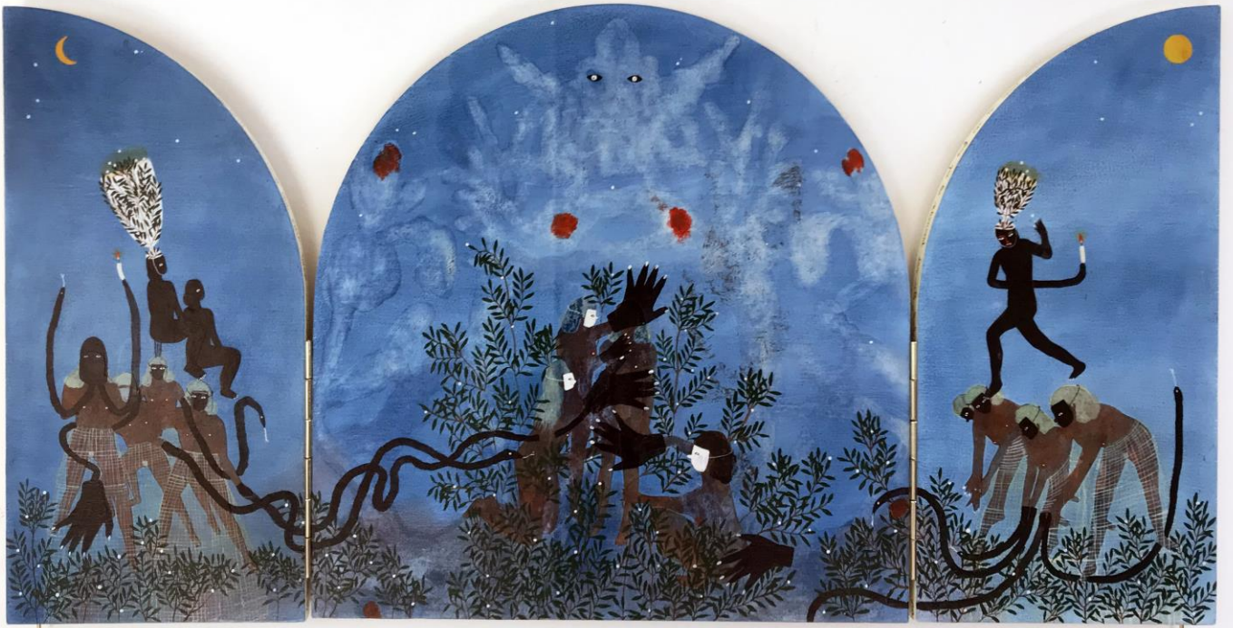
« La nuit est encore debout, c'est pour ça que je ne dors pas » (19) (ouvert / open) 2024, tech mixte sur bois / mixed media on wood, 30x30x2,5cm