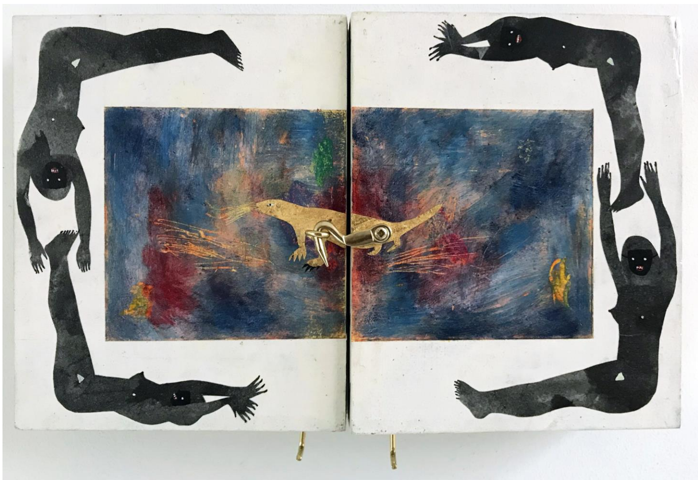
« La nuit est encore debout, c'est pour ça que je ne dors pas » (12) (fermé / closed) 2024, tech mixte sur bois / mixed media on wood, 22x14x2,5cm