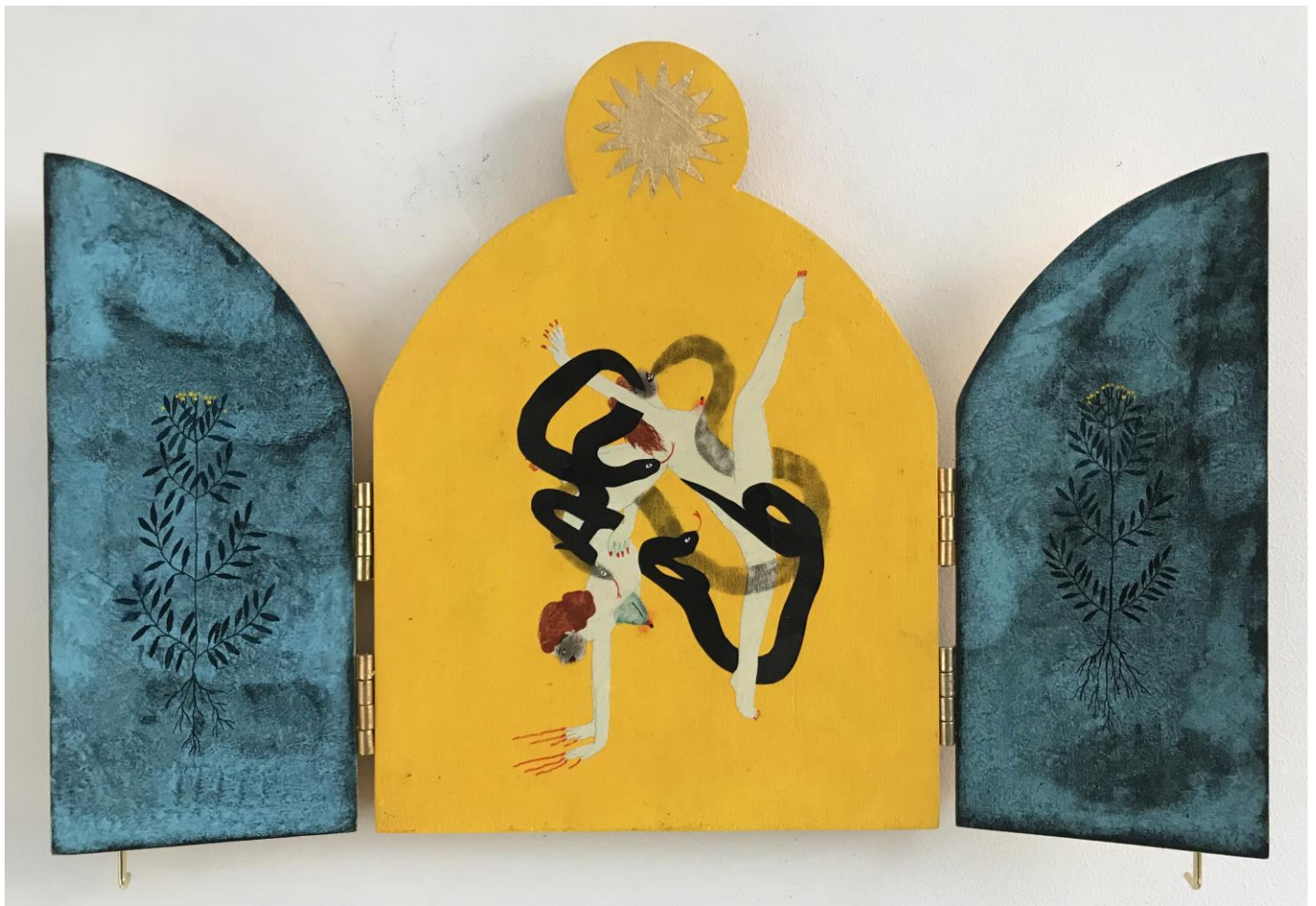
« La nuit est encore debout, c'est pour ça que je ne dors pas » (7) (ouvert / fermé)

2024, tech mixte sur bois / mixed media on wood, 20x15x2,5cm