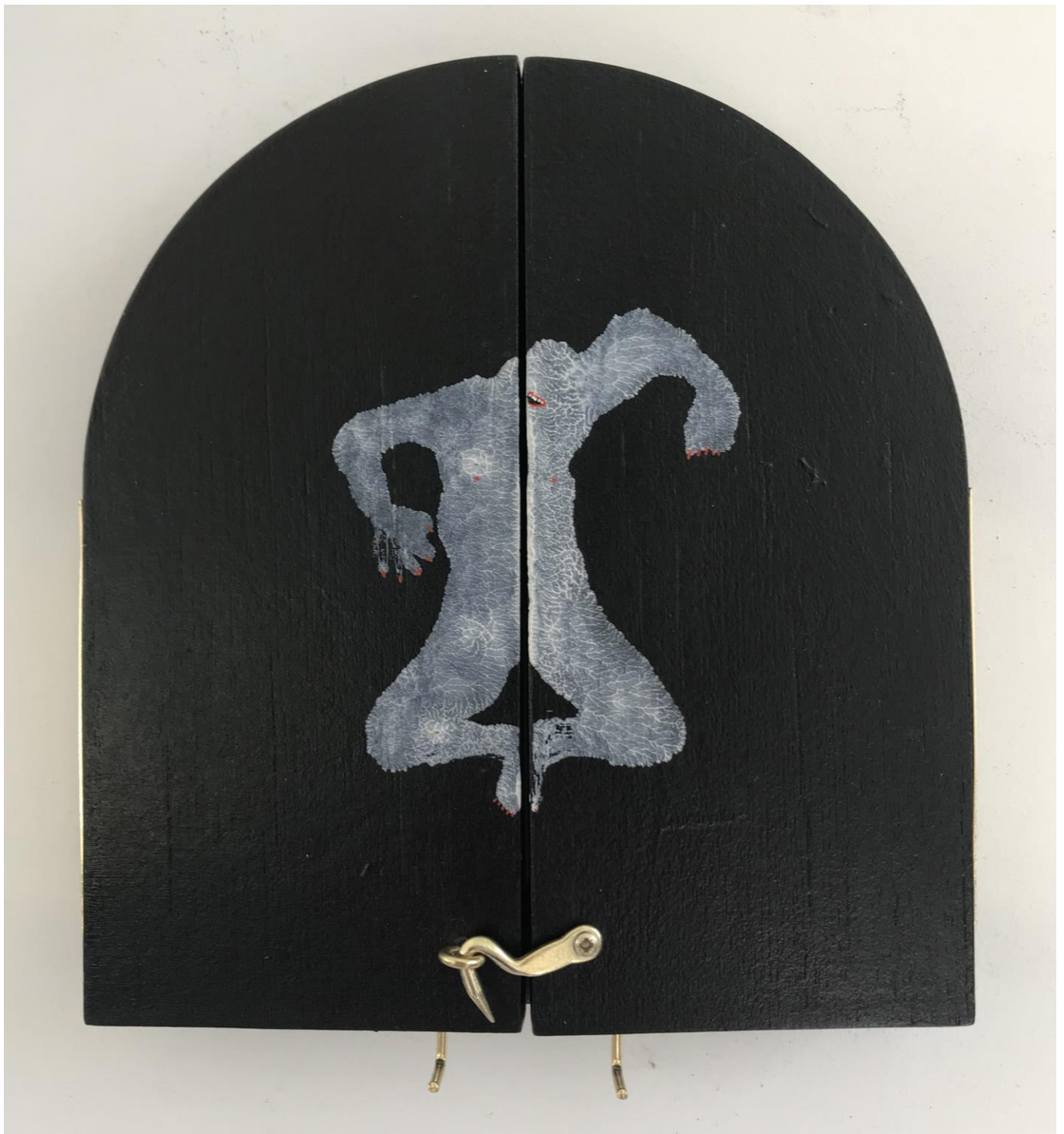
« La nuit est encore debout, c'est pour ça que je ne dors pas » (10) (fermé / closed) 2024, tech mixte sur bois / mixed media on wood, 17,5x16x2,5cm