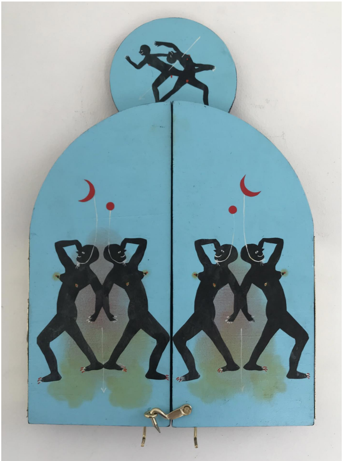
« La nuit est encore debout, c'est pour ça que je ne dors pas » (8) (fermé / closed) 2024, tech mixte sur bois / mixed media on wood, 28x26x2,5cm