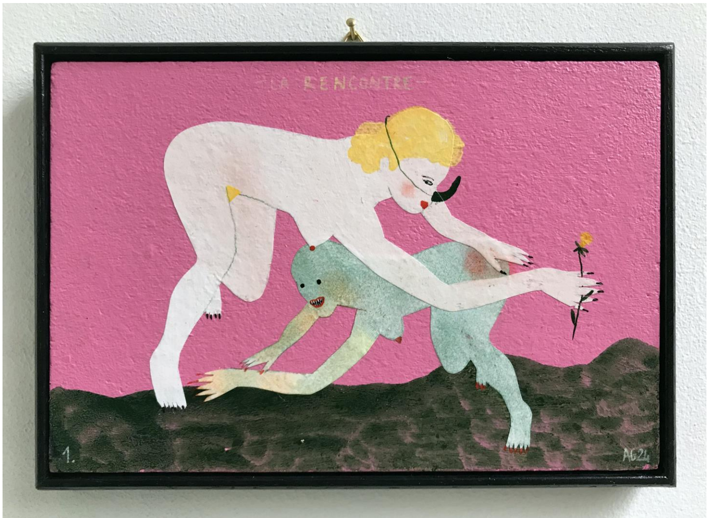
« La rencontre » (1)

2024, tech mixte sur bois / mixed media on wood, 11x16cm