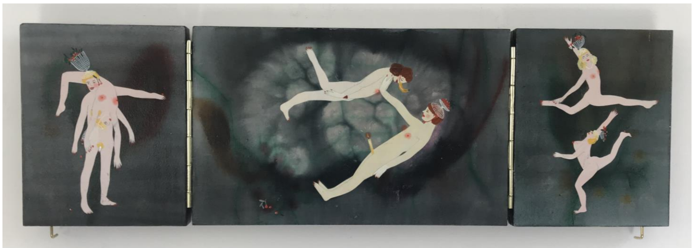
« La nuit est encore debout, c'est pour ça que je ne dors pas » (17) (ouvert / open) 2024, tech mixte sur bois / mixed media on wood, 14x22x2,5cm