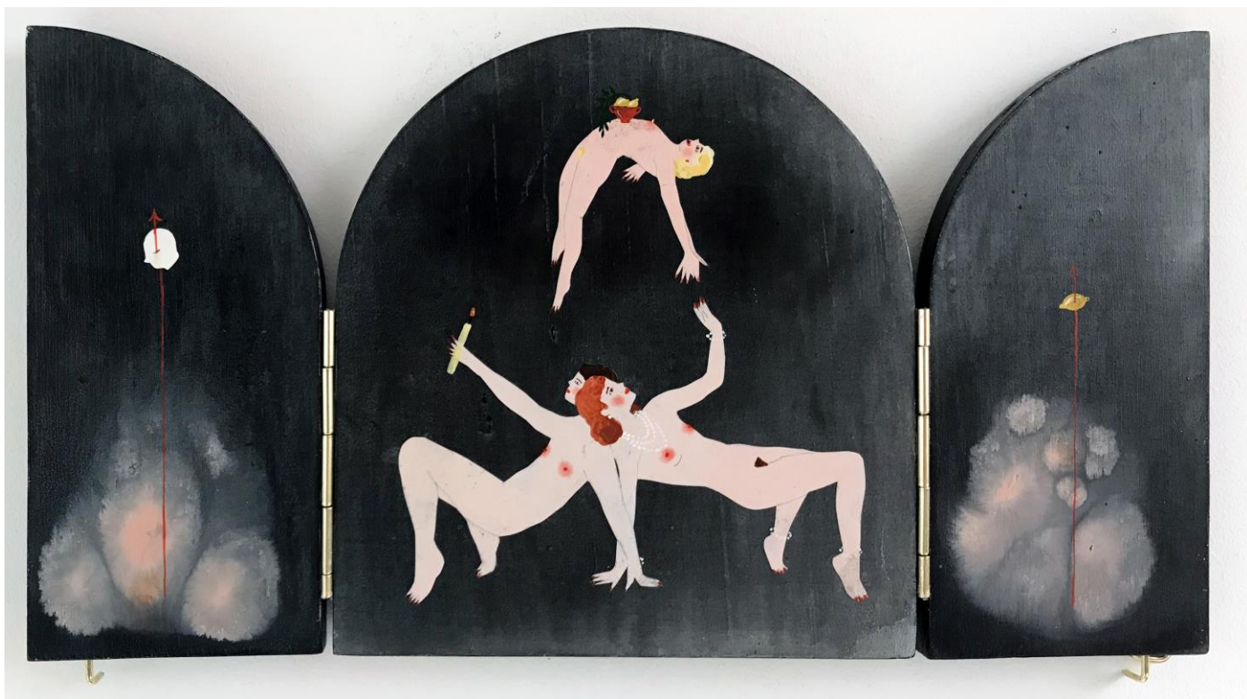
« La nuit est encore debout, c'est pour ça que je ne dors pas » (10) (ouvert / open) 2024, tech mixte sur bois / mixed media on wood, 17,5x16x2,5cm