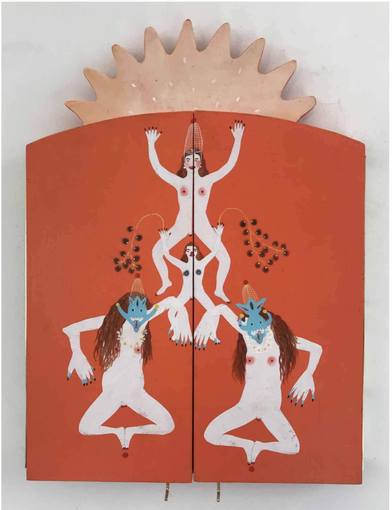
« La nuit est encore debout, c'est pour ça que je ne dors pas » (18) (fermé / closed) 2024, tech mixte sur bois / mixed media on wood, 30x21x2,5cm