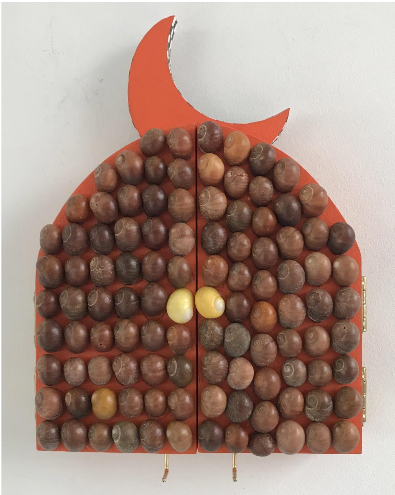
« La nuit est encore debout, c'est pour ça que je ne dors pas » (3) (fermé / closed) 2024, tech mixte sur bois / mixed media on wood, 20,5x15x2,5cm