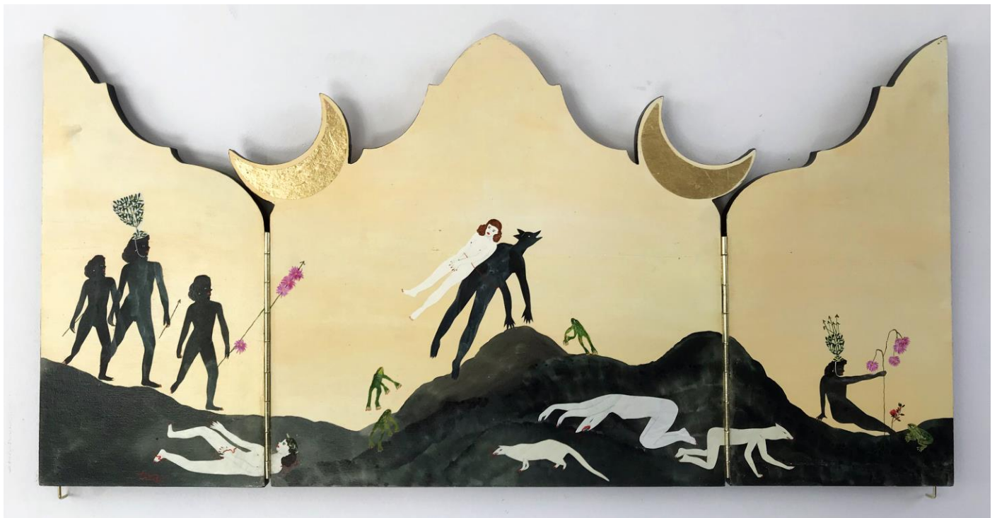
« La nuit est encore debout, c'est pour ça que je ne dors pas » (23) (ouvert / open) 2024, tech mixte sur bois / mixed media on wood, 30x30x2,5cm