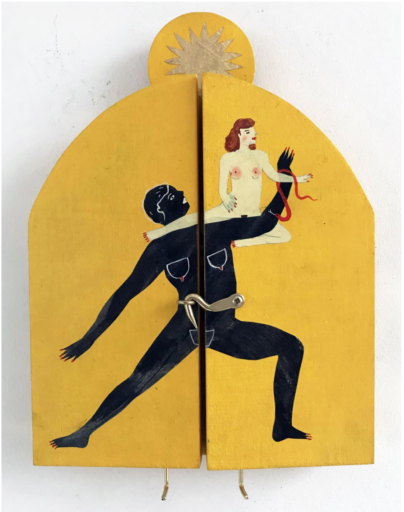
« La nuit est encore debout, c'est pour ça que je ne dors pas » (7) (fermé / closed) 2024, tech mixte sur bois / mixed media on wood, 20,5x15x2,5cm