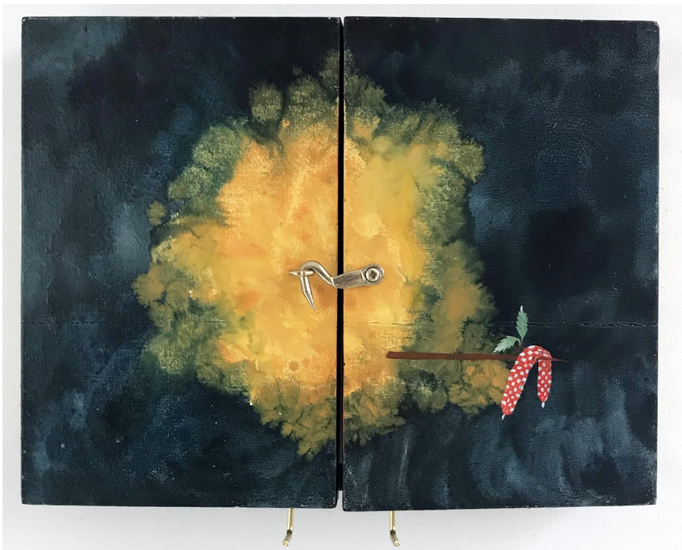
« La nuit est encore debout, c'est pour ça que je ne dors pas » (15) (fermé / closed) 2024, tech mixte sur bois / mixed media on wood, 15x19,5x2,5cm