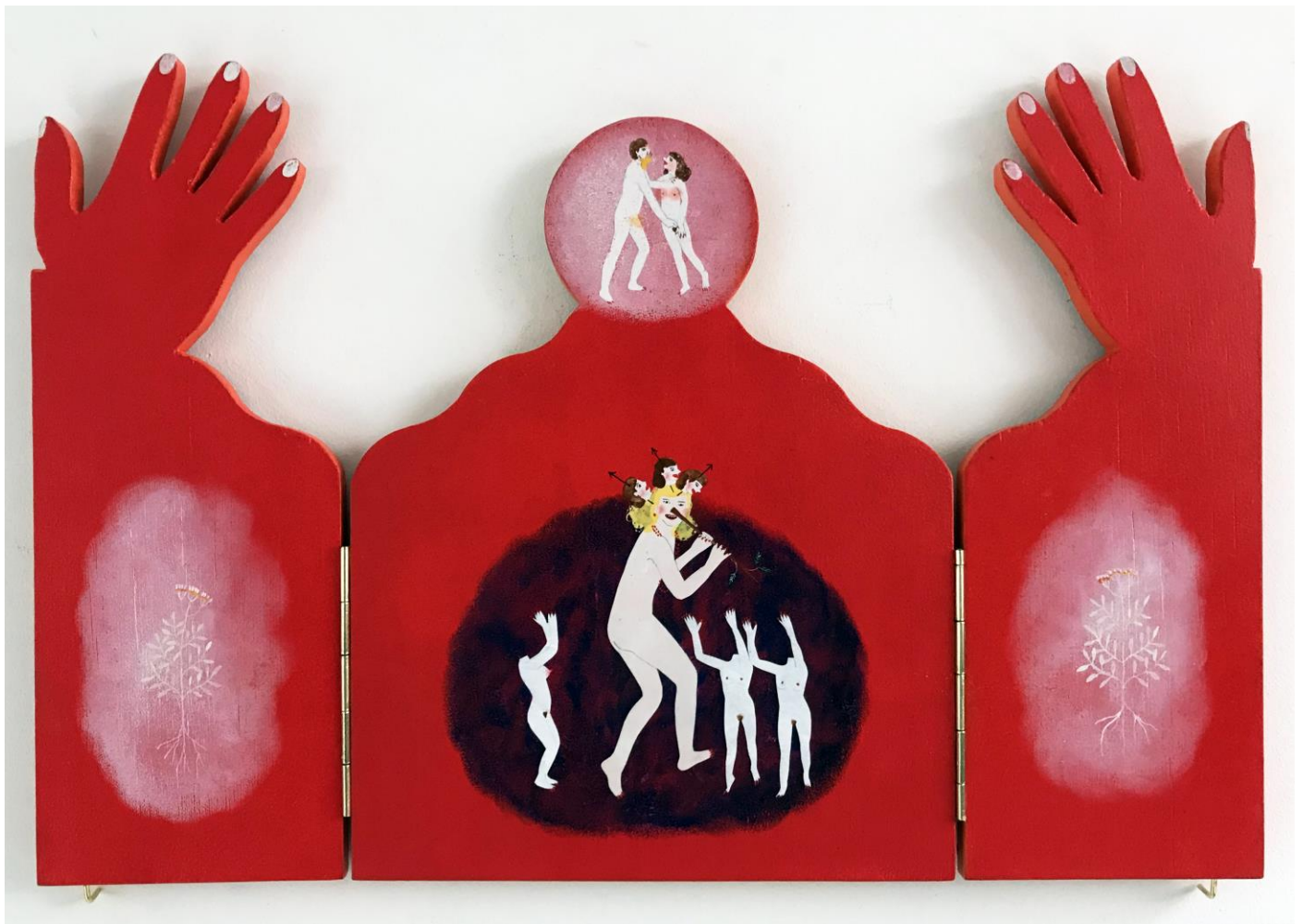
« La nuit est encore debout, c'est pour ça que je ne dors pas » (14) (ouvert / open) 2024, tech mixte sur bois / mixed media on wood, 29x21x2,5cm