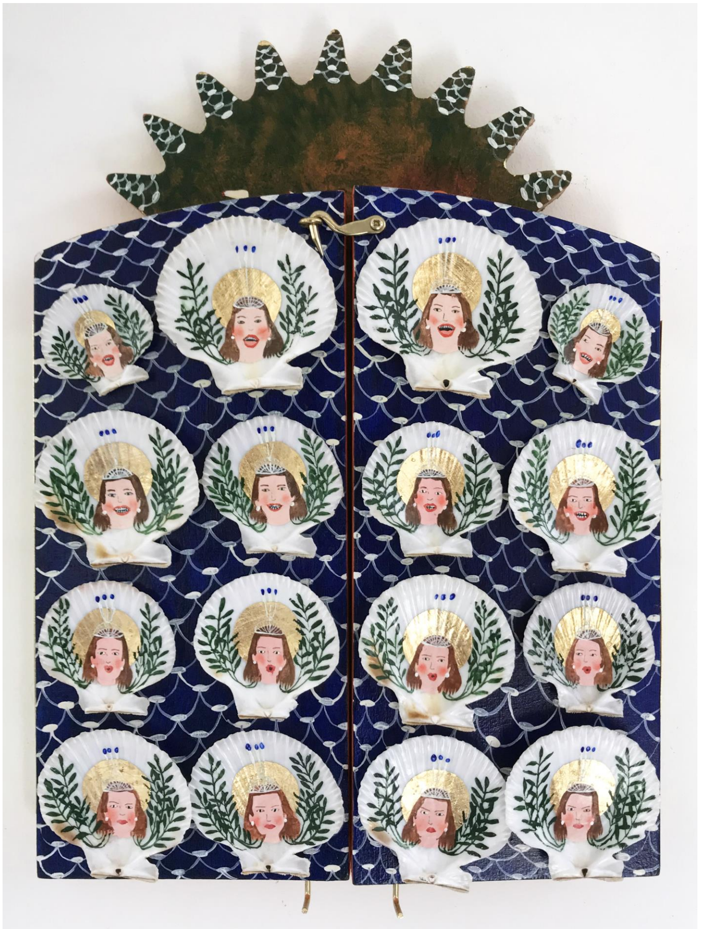
« La nuit est encore debout, c'est pour ça que je ne dors pas » (16) (fermé / closed) 2024, tech mixte sur bois / mixed media on wood, 31x21x2,5cm