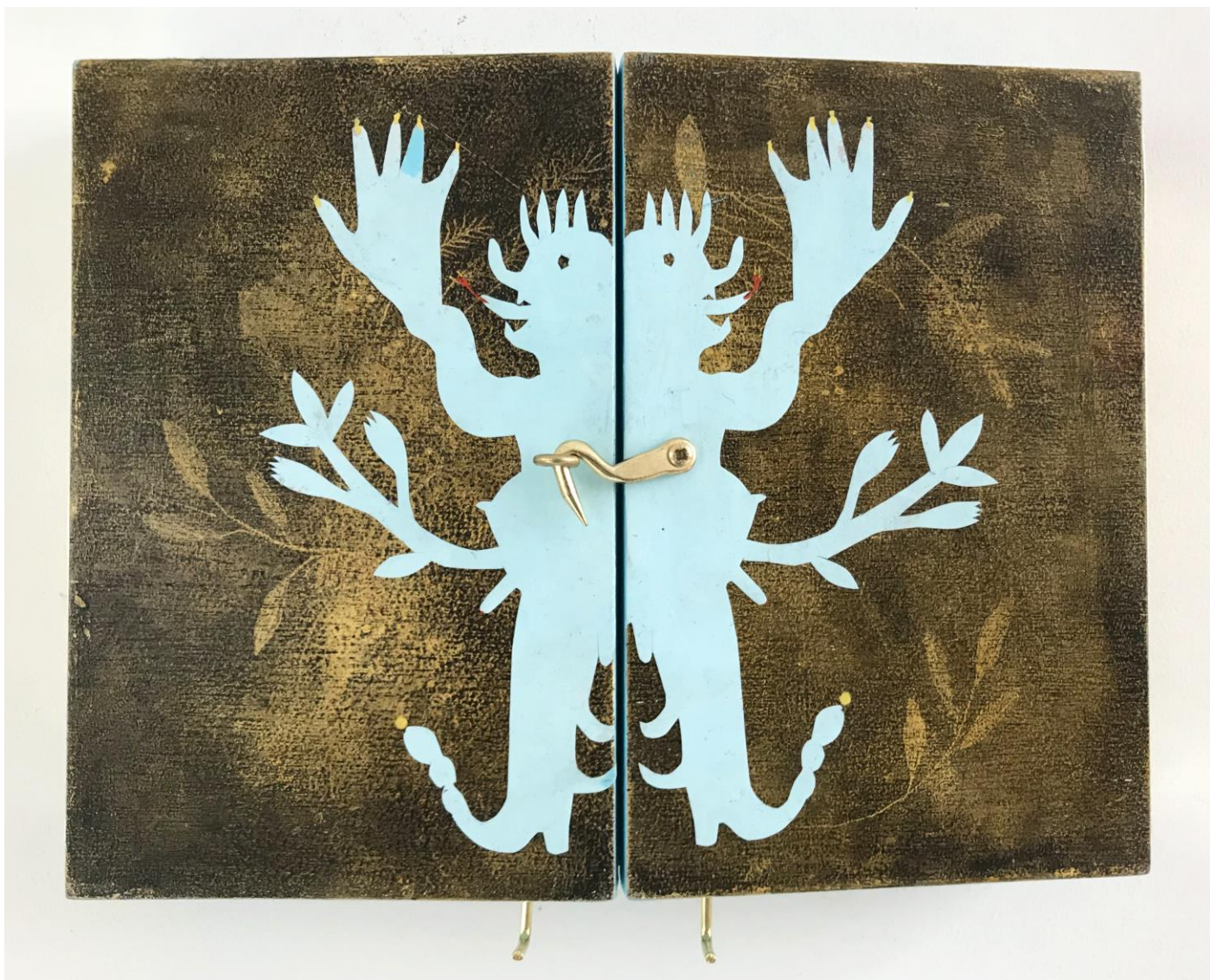
« La nuit est encore debout, c'est pour ça que je ne dors pas » (11) (fermé / closed) 2024, tech mixte sur bois / mixed media on wood, 15x20x2,5cm