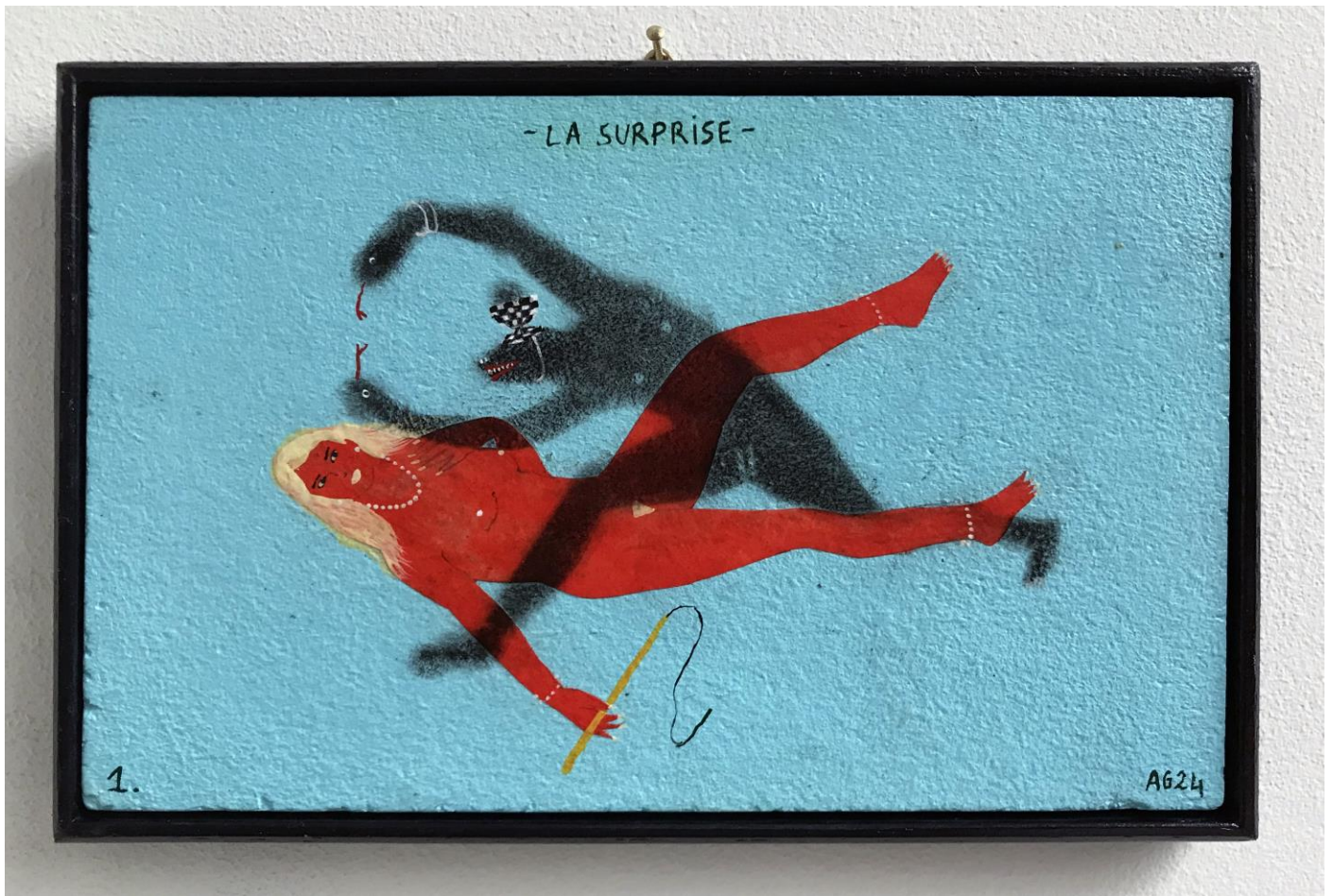
« La surprise » (1) 2024, tech mixte sur bois / mixed media on wood, 11x16cm