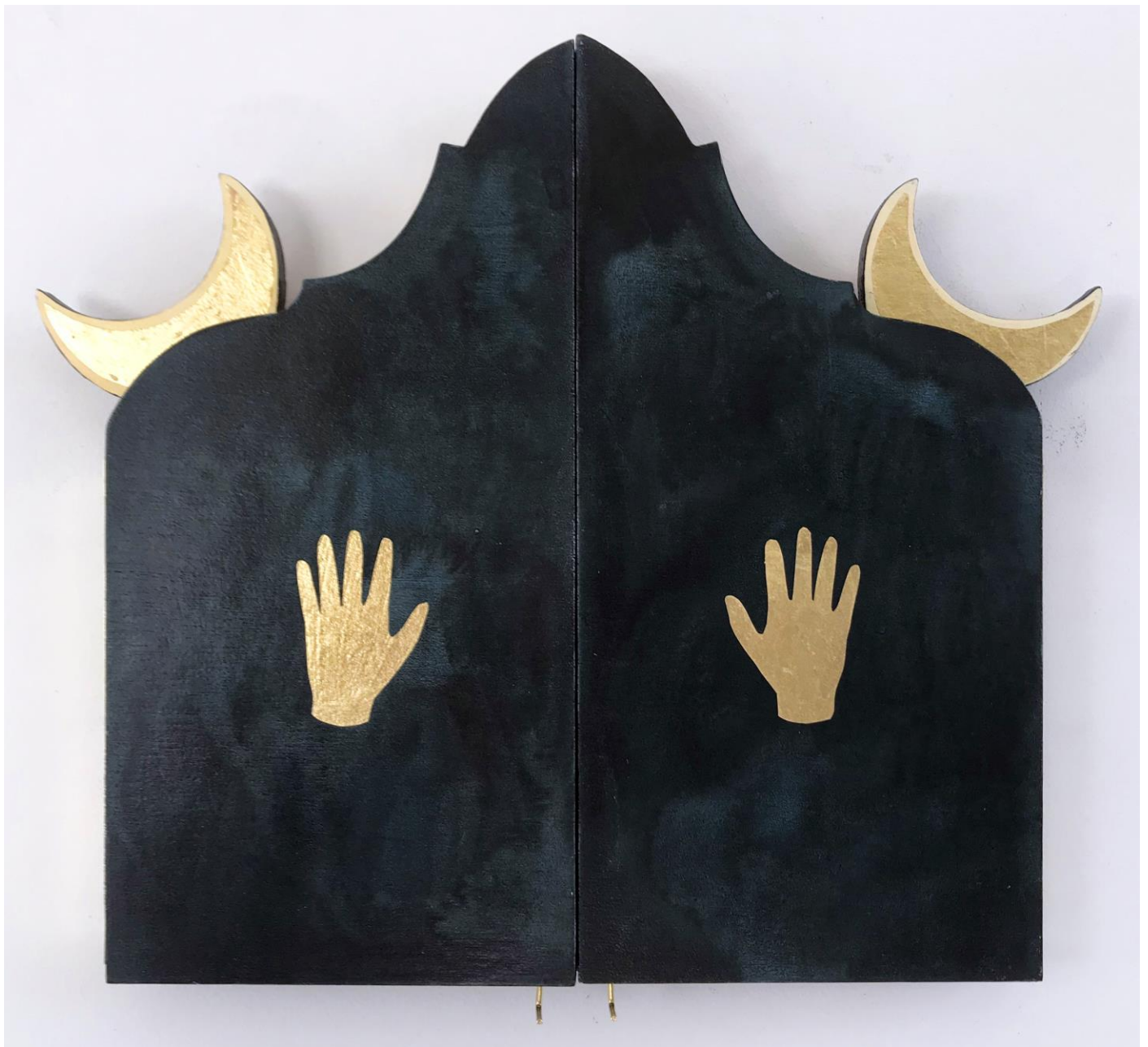
« La nuit est encore debout, c'est pour ça que je ne dors pas » (23) (fermé / closed) 2024, tech mixte sur bois / mixed media on wood, 30x30x2,5cm