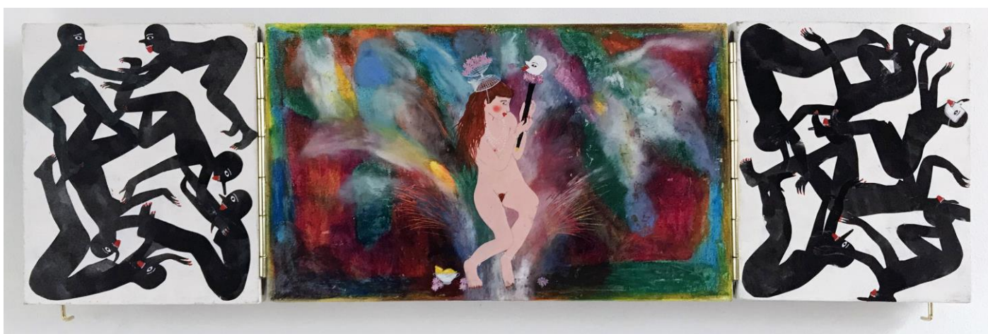
« La nuit est encore debout, c'est pour ça que je ne dors pas » (12) (ouvert / open) 2024, tech mixte sur bois / mixed media on wood, 22x14x2,5cm