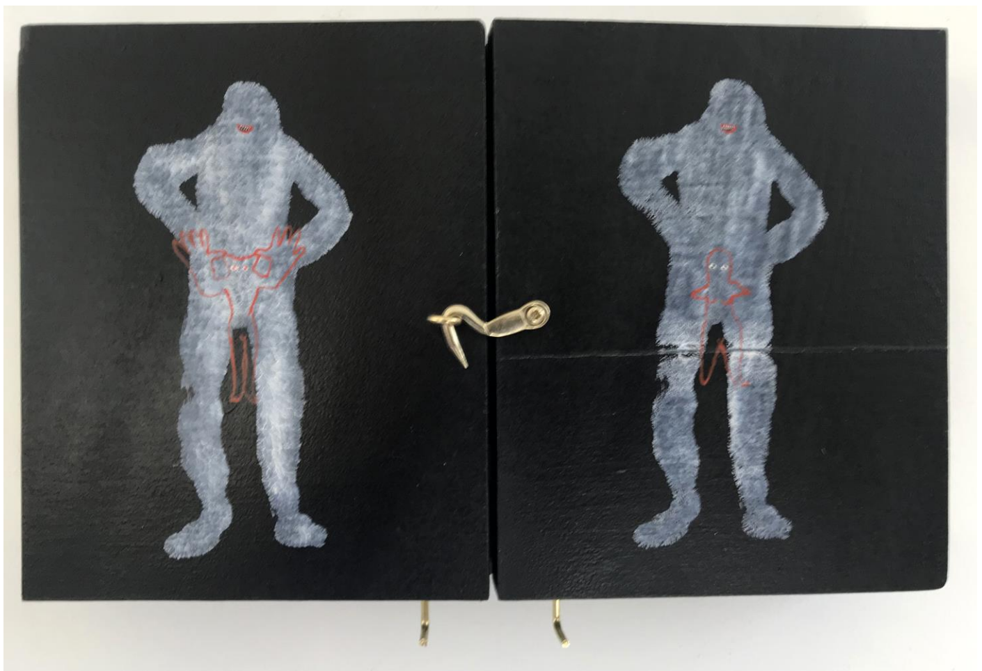
« La nuit est encore debout, c'est pour ça que je ne dors pas » (17) (fermé / closed) 2024, tech mixte sur bois / mixed media on wood, 14x22x2,5cm