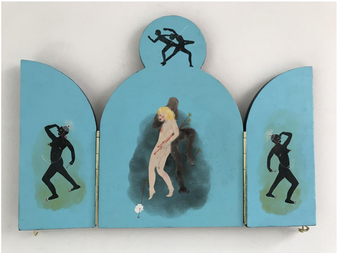
« La nuit est encore debout, c'est pour ça que je ne dors pas » (8) (ouvert / open) 2024, tech mixte sur bois / mixed media on wood, 28x26x2,5cm