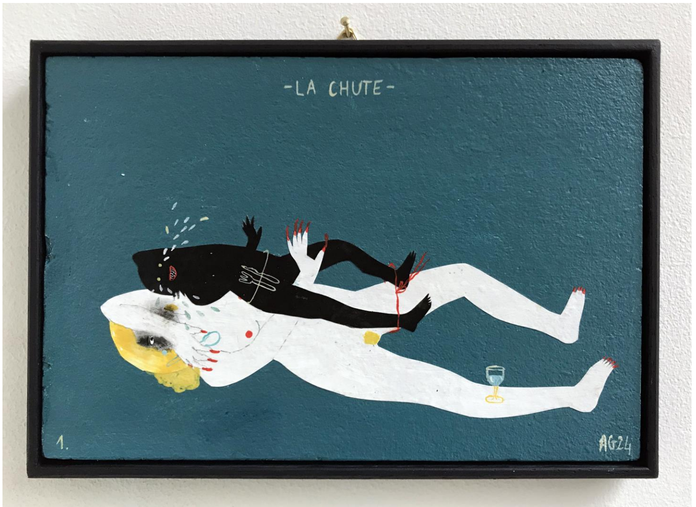
« La chute » (1)

2024, tech mixte sur bois / mixed media on wood, 11x16cm