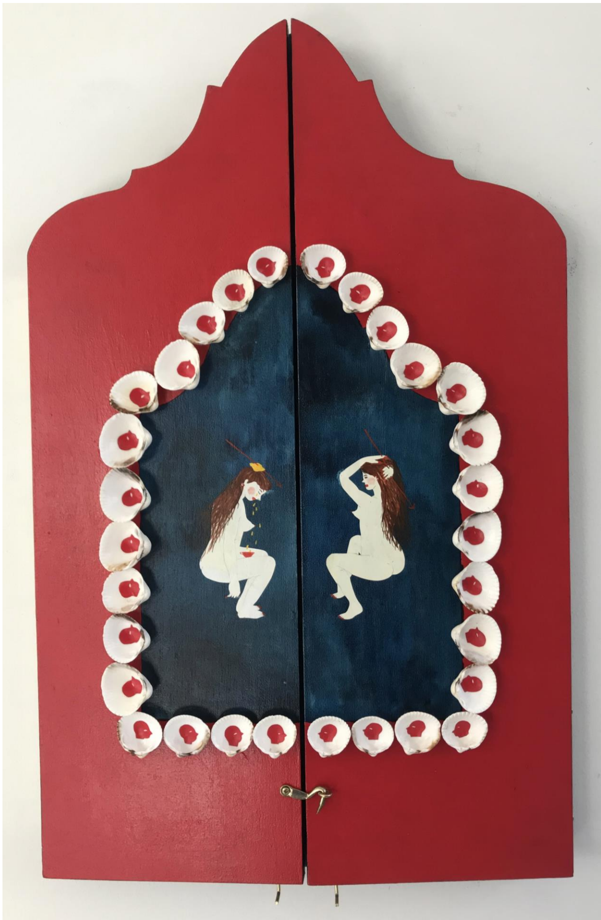
« La nuit est encore debout, c'est pour ça que je ne dors pas » (24) (fermé / closed) 2024, tech mixte sur bois / mixed media on wood, 47x29,5x2,5cm