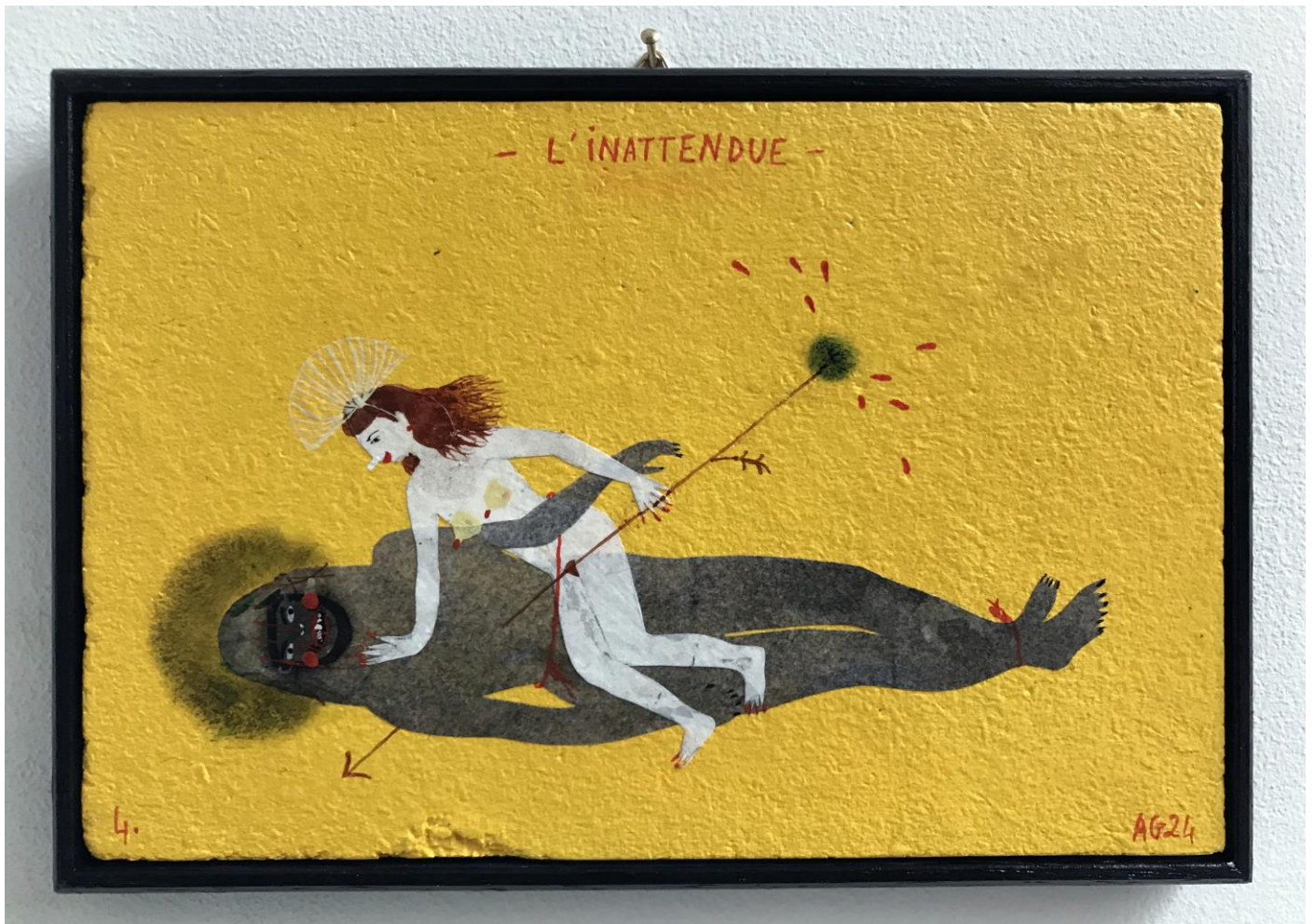
« L'inattendue » (4)

2024, tech mixte sur bois / mixed media on wood, 11x16cm