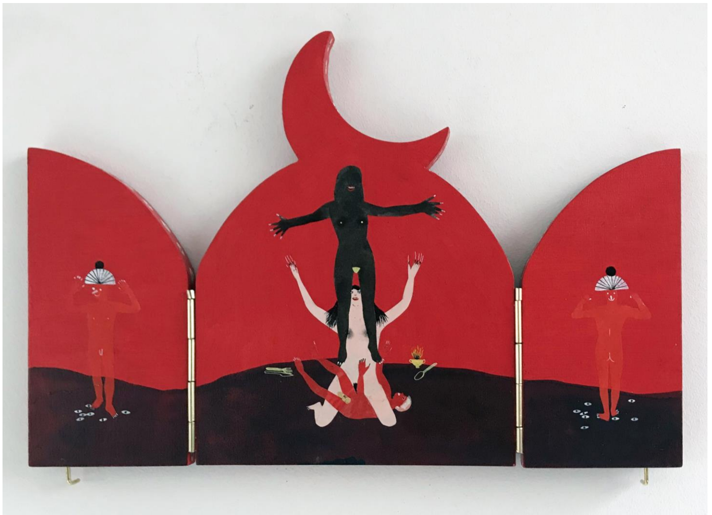
« La nuit est encore debout, c'est pour ça que je ne dors pas » (5) (ouvert / open) 2024, tech mixte sur bois / mixed media on wood, 20,5x15x2,5cm