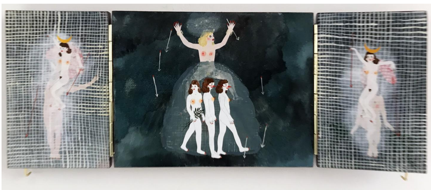
« La nuit est encore debout, c'est pour ça que je ne dors pas » (15) (ouvert / open) 2024, tech mixte sur bois / mixed media on wood, 15x19,5x2,5cm