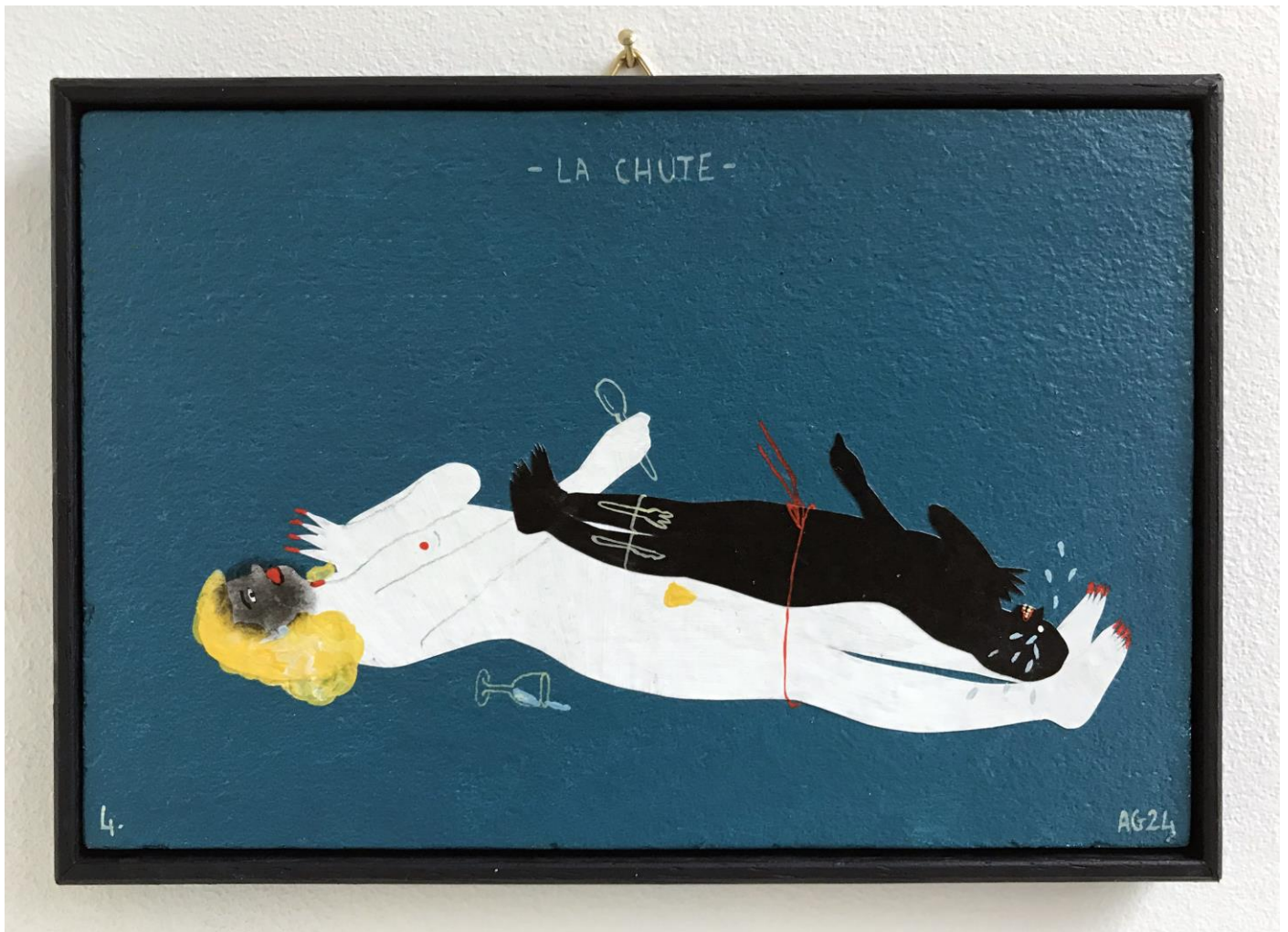
« La chute » (4) 2024, tech mixte sur bois / mixed media on wood, 11x16cm