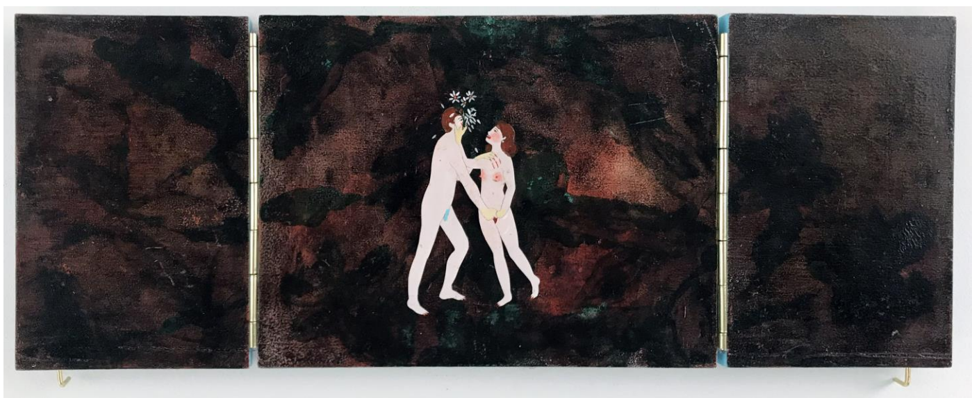
« La nuit est encore debout, c'est pour ça que je ne dors pas » (11) (ouvert / open) 2024, tech mixte sur bois / mixed media on wood, 15x20x2,5cm