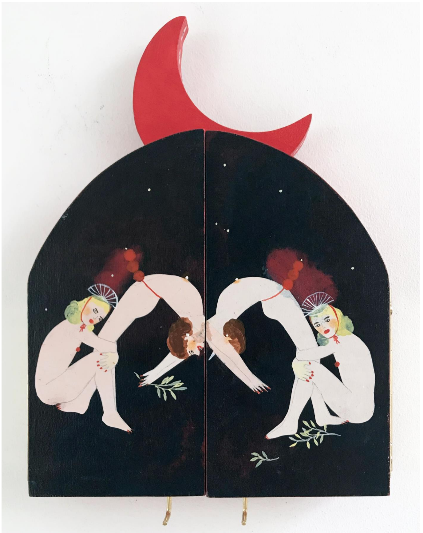
« La nuit est encore debout, c'est pour ça que je ne dors pas » (5) (fermé / closed) 2024, tech mixte sur bois / mixed media on wood, 20,5x15x2,5cm