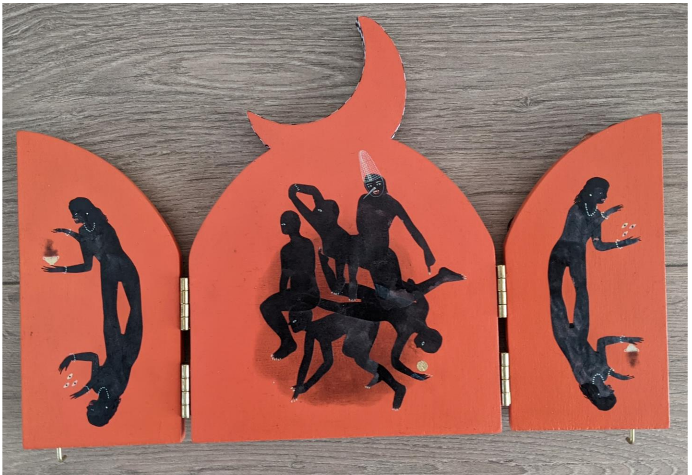
« La nuit est encore debout, c'est pour ça que je ne dors pas » (27) (ouvert / open)

2024, tech mixte sur bois / mixed media on wood, 20,5x15x2,5cm