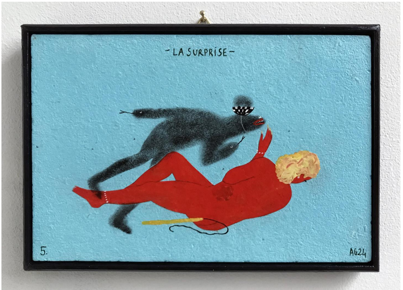
« La surprise » (5)

2024, tech mixte sur bois / mixed media on wood, 11x16cm