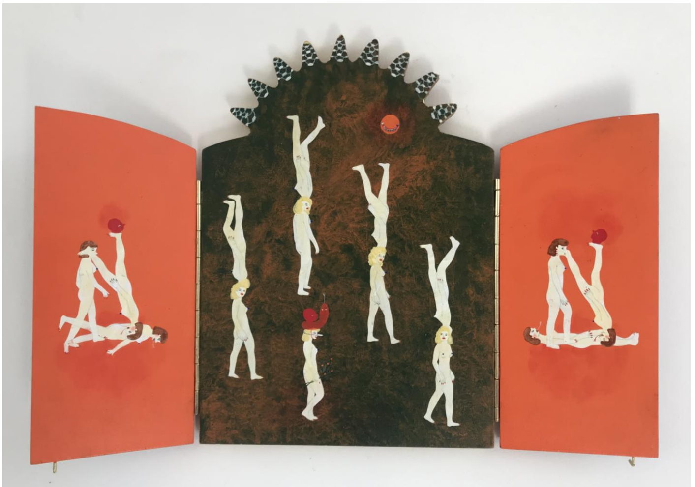
« La nuit est encore debout, c'est pour ça que je ne dors pas » (16) (ouvert / open) 2024, tech mixte sur bois / mixed media on wood, 31x21x2,5cm