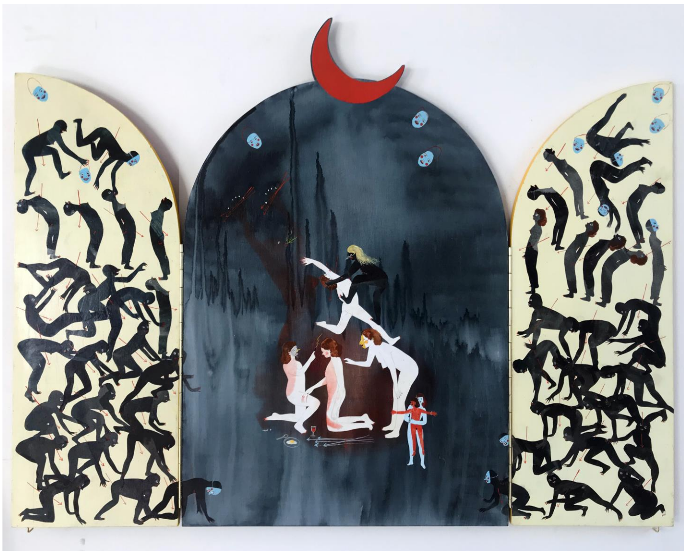
« La nuit est encore debout, c'est pour ça que je ne dors pas » (26) (ouvert / open) 2024, tech mixte sur bois / mixed media on wood, 56,5x37x2,5cm