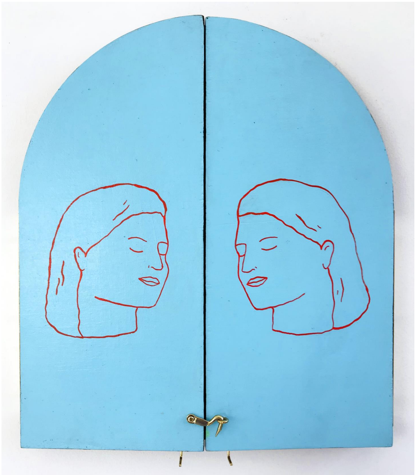
« La nuit est encore debout, c'est pour ça que je ne dors pas » (20) (fermé / closed) 2024, tech mixte sur bois / mixed media on wood, 30,5x26,5x2,5cm