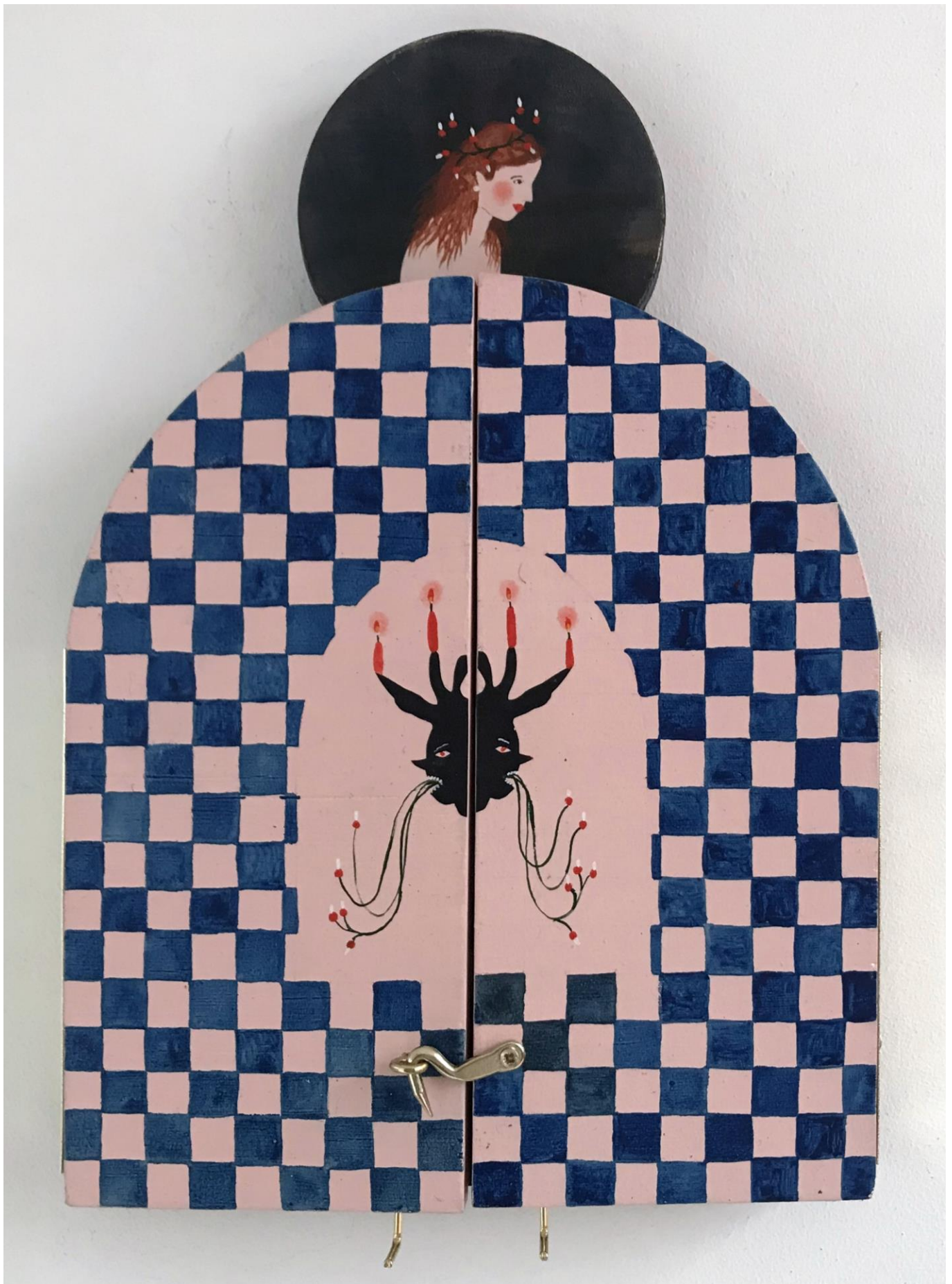
« La nuit est encore debout, c'est pour ça que je ne dors pas » (9) (fermé / closed) 2024, tech mixte sur bois / mixed media on wood, 26x18x2,5cm