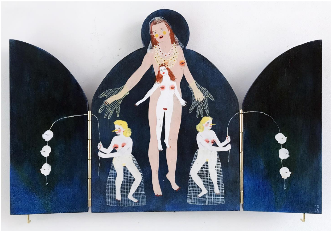
« La nuit est encore debout, c'est pour ça que je ne dors pas » (6) (ouvert / open) 2024, tech mixte sur bois / mixed media on wood, 20x15x2,5cm