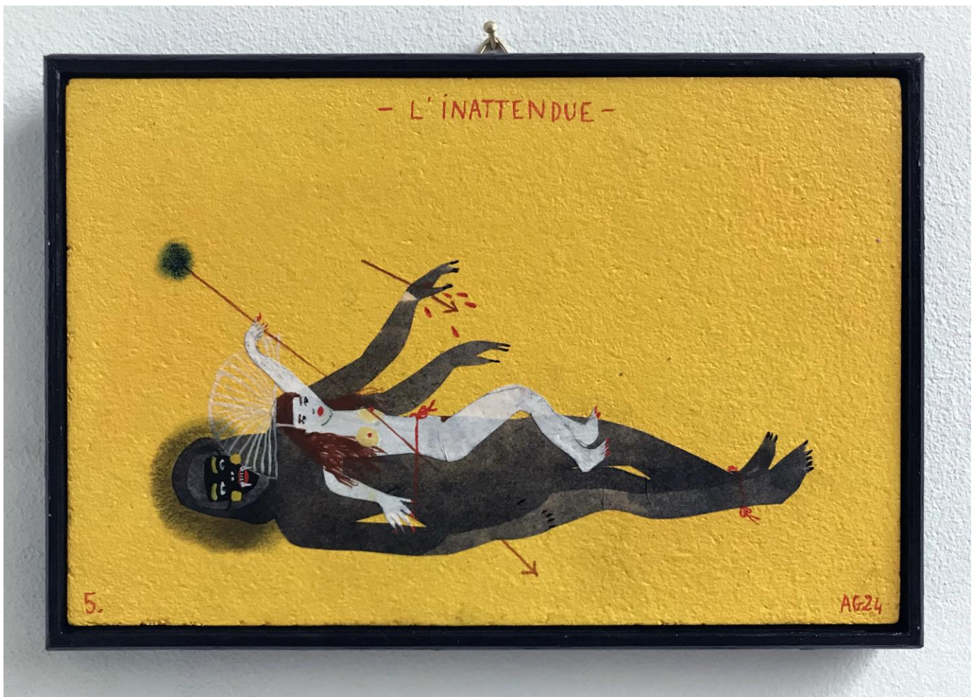
« L'inattendue » (5)

2024, tech mixte sur bois / mixed media on wood, 11x16cm