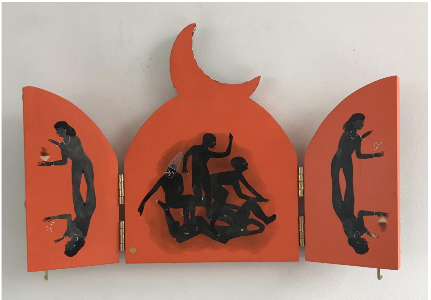
« La nuit est encore debout, c'est pour ça que je ne dors pas » (4) (ouvert / open) 2024, tech mixte sur bois / mixed media on wood, 20,5x15x2,5cm