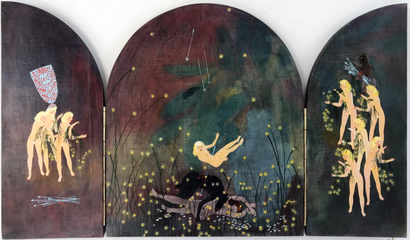
« La nuit est encore debout, c'est pour ça que je ne dors pas » (20) (ouvert / open) 2024, tech mixte sur bois / mixed media on wood, 30,5x26,5x2,5cm