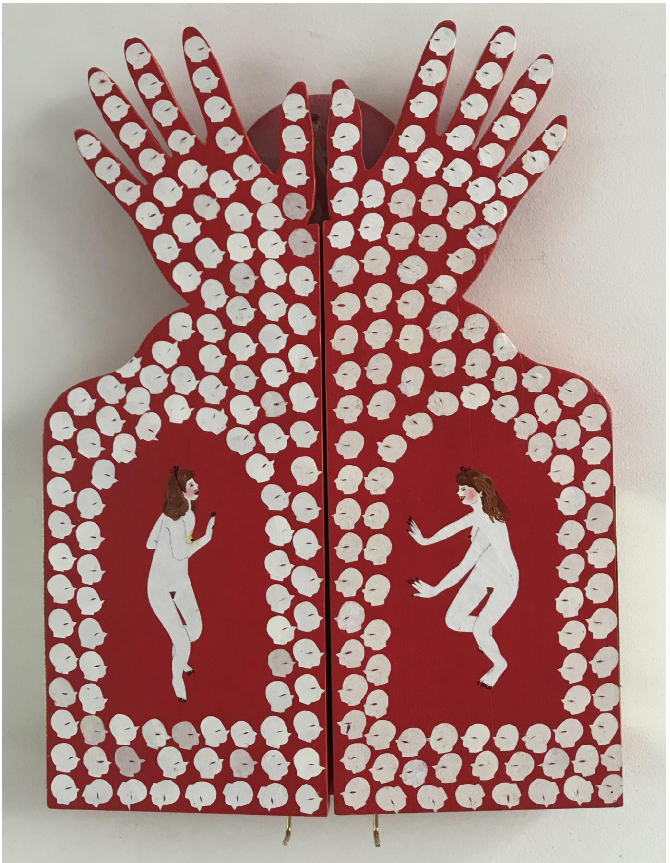
« La nuit est encore debout, c'est pour ça que je ne dors pas » (14) (fermé / closed) 2024, tech mixte sur bois / mixed media on wood, 29x21x2,5cm