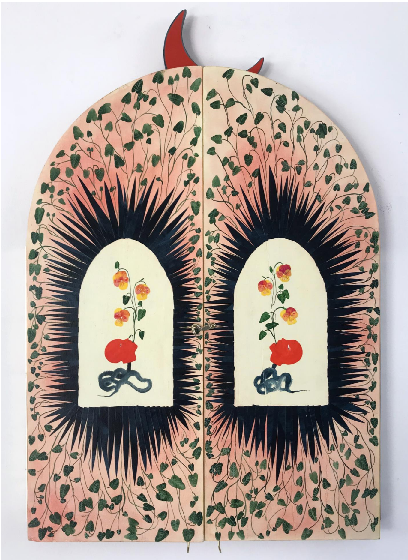
« La nuit est encore debout, c'est pour ça que je ne dors pas » (26) (fermé / closed)

2024, tech mixte sur bois / mixed media on wood, 56,5x37x2,5cm