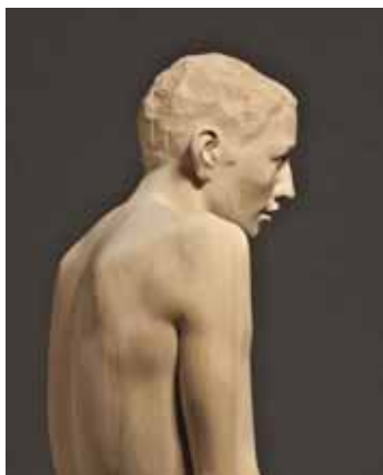
'Bois #119', gelamineerd lindehout, rode lijm, 210 x 46 x 18 cm, 2014 (detail). © Mario Dilitz. Prijs: € 5.000 tot 35.000.

De getalenteerde beeldhouwer Mario Dilitz (Oostenrijk, 1973) creëert menselijke figuren van gelamineerd hout van uitgelezen kwaliteit. Via een proces van afbraak en reconstructie krijgt het hout een nieuwe, stabiele vorm, die het van nature nooit kan hebben. Die liefde voor natuurlijke materialen stamt uit zijn kinderjaren. Zijn vader was een beeldhouwer