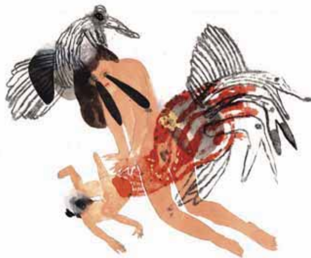
Annabelle Guetatra, 'Les Abysses 2', 29,7 x 42 cm, gemengde techniek op papier, 2015. © Annabelle Guetatra. Prijs: € 700 tot 4.000.

Galerie Pascal Polar Charloisesteenweg 108, Brussel - www.pascalpolar.be - t/m 28-11