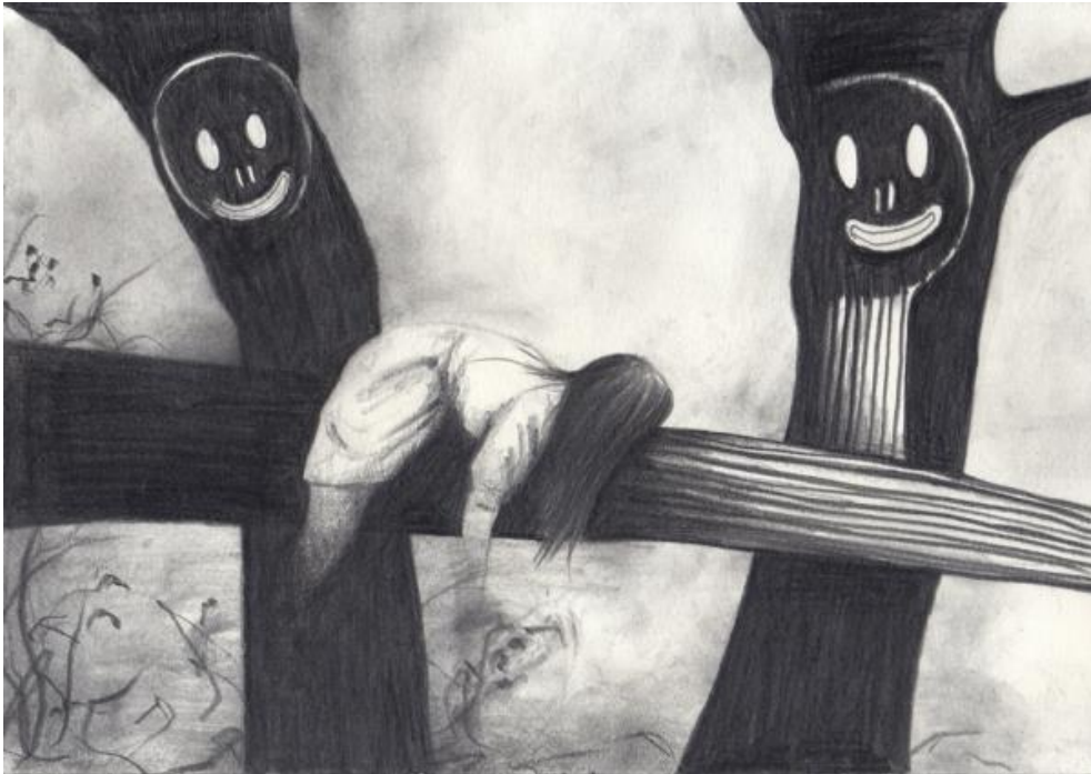
Emeli Theander, Forest , 2015, graphite sur papier, 21 x 29,7 cm