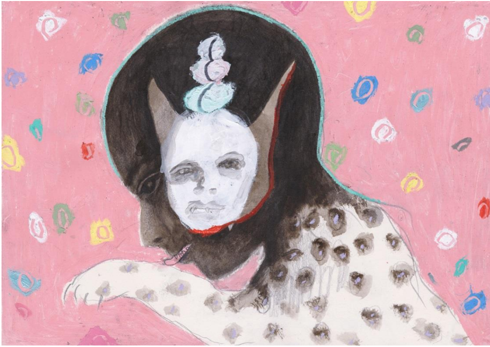
Emeli Theander, Leopard , 2017, graphite, encre et pastel gras sur papier, 29,7 x 42 cm