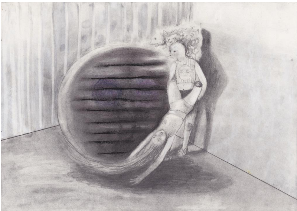
Emeli Theander, Spinning Around , 2016, graphite et pastel sur papier 29,7 x 42 cm