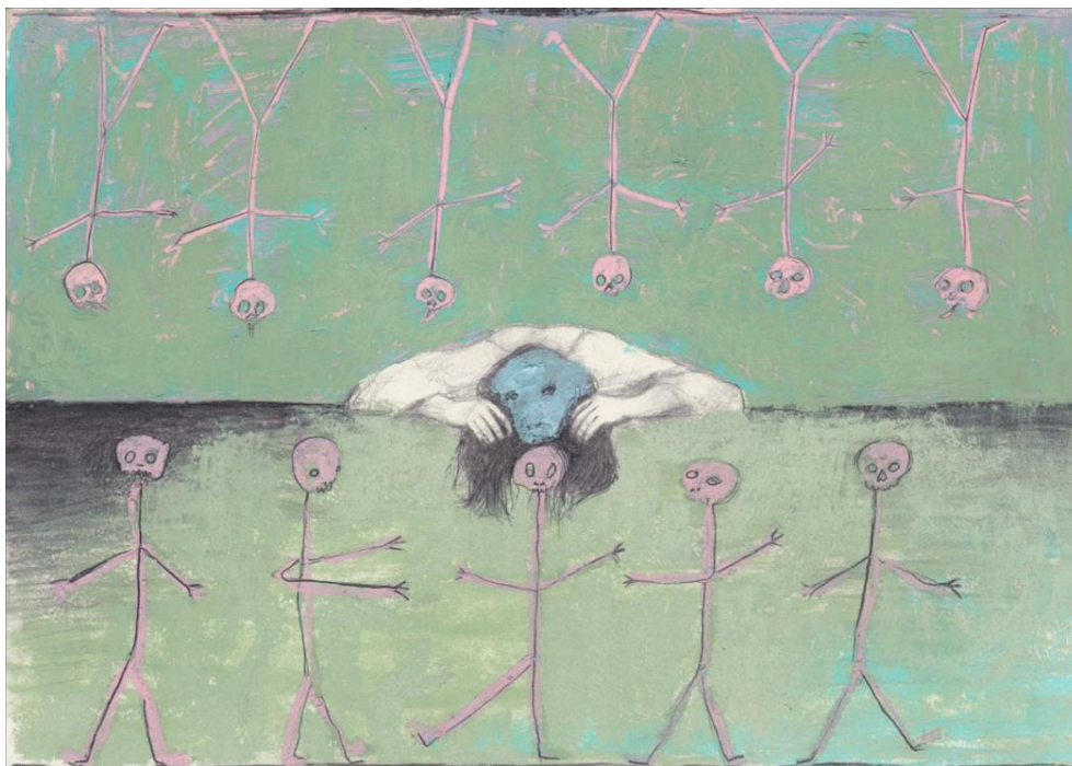
Emeli Theander, Skeletons , 2017, graphite et pastel gras sur papier, 29,7 x 42 cm